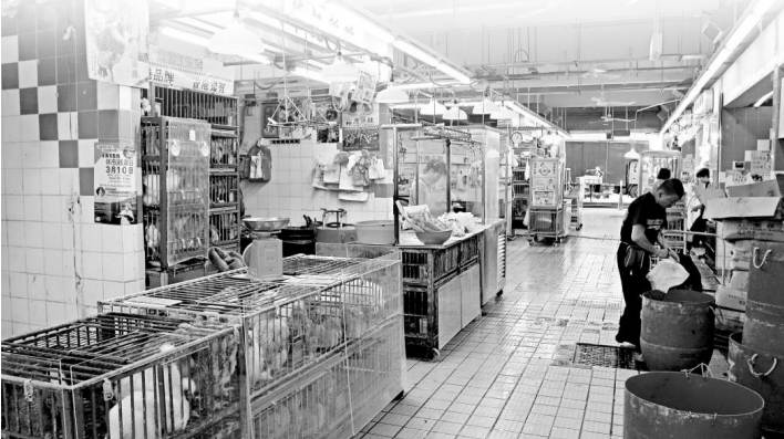
▲街市雞檔生意隨時受到今次事件影響

本港再有人感染H5N1，有專家說，內地近期並未爆發，相信本次個案屬零星個案，本港不會出現大規模爆發。 中國著名呼吸疾病專家鍾南山在廣州接受查詢時表示，禽流感沒有季節性，現時禽流感仍然是散發性，偶爾都會有。最近，內地也發生禽流感，這是個別的，是散發。目前為止，沒有跡象表明禽流感有大爆發的跡象，危險性不大；亦沒有證據表明禽流感人傳人，還沒有發生人與人之間的有效傳播。他又表示，現時有充足證據表明禽流感主要是通過禽類傳染給人，儘管可能存在人通過環境因素而感染，但這種途徑非常局限。 本港的專家所持的意見也相若。港大感染及傳染病中心總監何栢良表示，本港多年來都沒有禽流感人類感染個案發生，相信今次的H5N1個案，屬外地傳入機會較大。另外，根據內地公布，近期並無爆發，本次很大機會是零星個案。 何栢良說，禽流感病毒主要經由接觸活禽與家禽，本港街市雞檔已實施