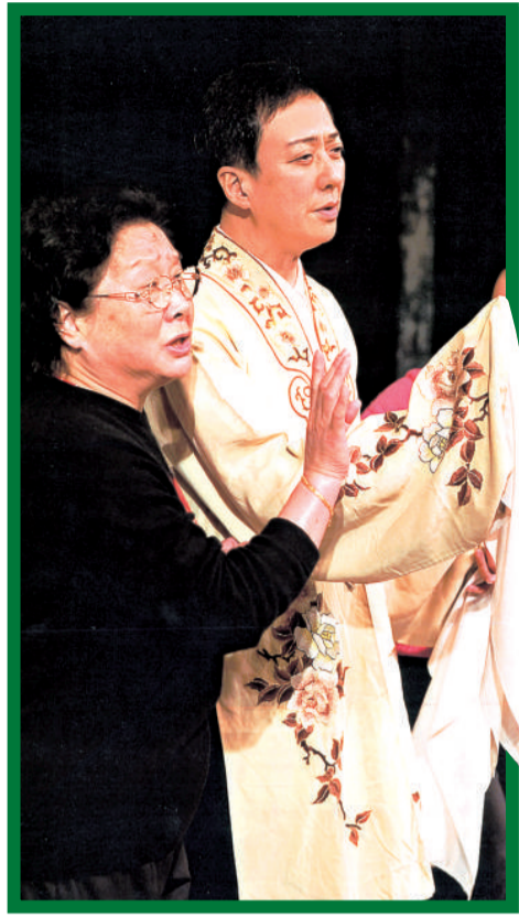
▲坂東玉三郎(右)曾向張繼青學習崑劇旦角造詣