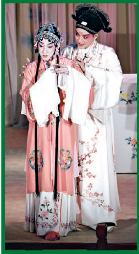
▲飾演杜麗娘的坂東玉三郎(左)與飾演柳夢梅的俞玖林合作了六十多次

【本報訊】記者洪捷報道：崑劇是我國歷史悠久的文化遺產，表演的程式有嚴謹的規範，可說難學難精，日本著名歌舞伎大師坂東玉三郎挑戰高難度，在四年內完成學習排演中日版崑劇《牡丹亭》，並在北京、上海、蘇州、南京、東京等大城市演出，大受歡迎，觀眾人次已超過八萬。坂東玉三郎應「新視野藝術節」之邀來港演出，三場門票半個月前已全部售罄，昨日他抵埗後會見新聞界，分享演出《牡丹亭》經驗。