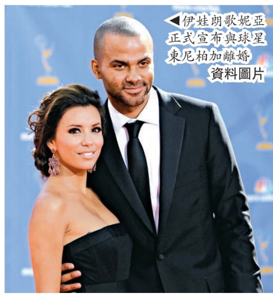
▲伊娃朗歌妮亞正式宣布與球星東尼柏加離婚 資料圖片

兩人在第一時間都不願針對離婚一事多做評論，只在Twitter上表示：「我們深深愛著對方，