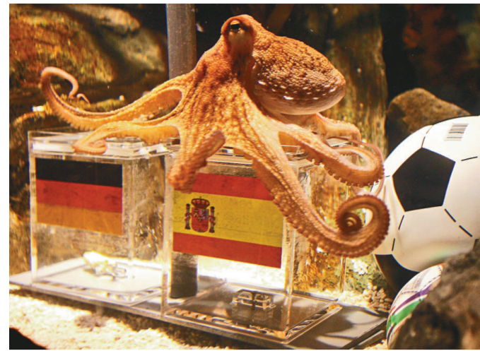
科學家指出，人類可能也擁有預知的能力