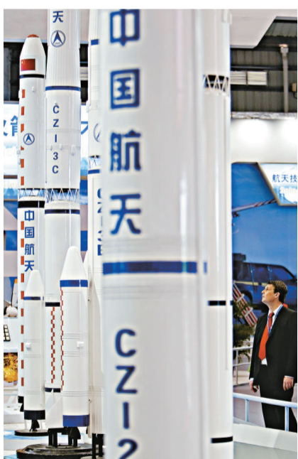
▲中國航天科技通過航展更受國際重視 彭博社