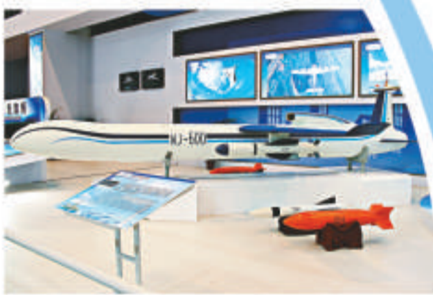
▲國產無人偵察及對地攻擊機可掛精準炸彈

機多數是來自生產線上的實物，但為適應航展需要而卸去部分關鍵部件。時揚表示，在目前非作戰階段，各類無人機主要作用在於偵察、監視、定位、毀傷評估等方面，而針對作戰等緊急狀態，即使「天象一號」無人船、機器人等也將納入無人作戰體系中。 除了信息戰外，近幾年伊拉克和阿富汗戰爭的經驗也顯示，有時大威力武器遠比不上一顆能準確命中目標卻不傷及無辜的小直徑炸彈。其中，在航展上現身的最新型「小直徑精確制導炸彈」、75公斤級的防空攔截兵器之外，並未發現被美方視為「眼中釘」的DF21導彈，不過據軍工專家指出，「東風-21D」反航母彈道導彈近年一直被國外視為攻擊航母的主戰武器，甚為敏感，因此暫時還很難在公開場合現身。