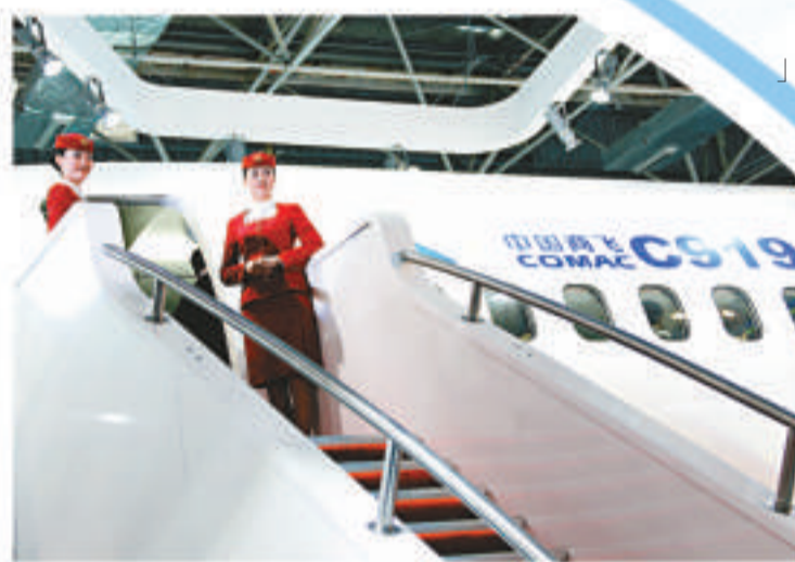
◀備受矚目的中國C919大型客機展示樣機在珠海航展揭開神秘面紗

AVIATION，意大利華寶鋼廠、俄羅斯普瑞瑪公司、烏克蘭 FED 飛機機械製造集團及德國 GRW 和 Tital GMBH 公司等首次參展。值得一提的是，美國知名航空航天下企業霍尼韋爾公司在闊別8年後也重返中國航展舞台，這大大提高本屆航展的國際化和專業化水平，也意味着中國航展的國際影響力在不斷擴大。 本屆海外參展飛機尤其是直升機參展規模大幅提升，國內引進的最先進的S-92直升機、歐洲直升機公司的EC225直升機、意大利阿古斯特公司研製的EH101、A109E直升機皆有參展。而空巴A380巨無霸進行飛行表演，在近期事故頻發的陰霾下給中國客戶派出「定心丸」，空巴僅今年內便向中國的航空公司交付超過100架飛機，佔全球交付量的1/5。