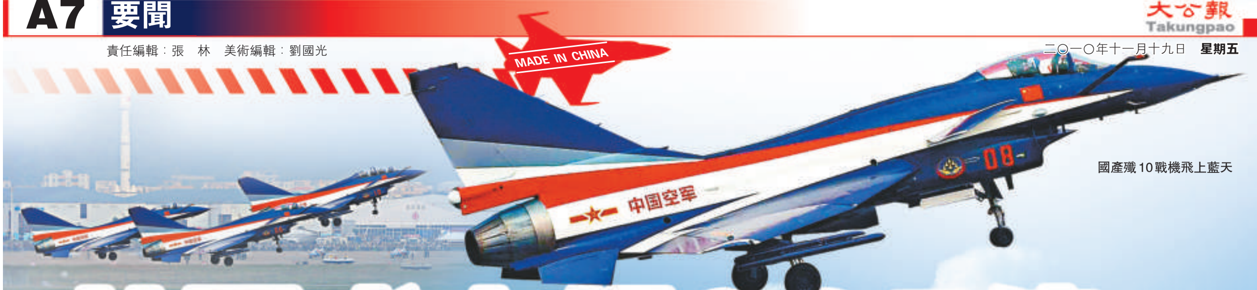
國產殲10戰機飛上藍天