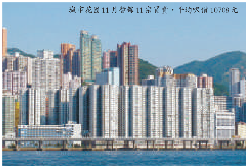
城市花園11月暫錄11宗買賣，平均呎價10708元

原業主於1992年1月以538萬元購入，持貨18年帳面勁賺1260萬元離場，物業升值近3.3倍，該屋苑同