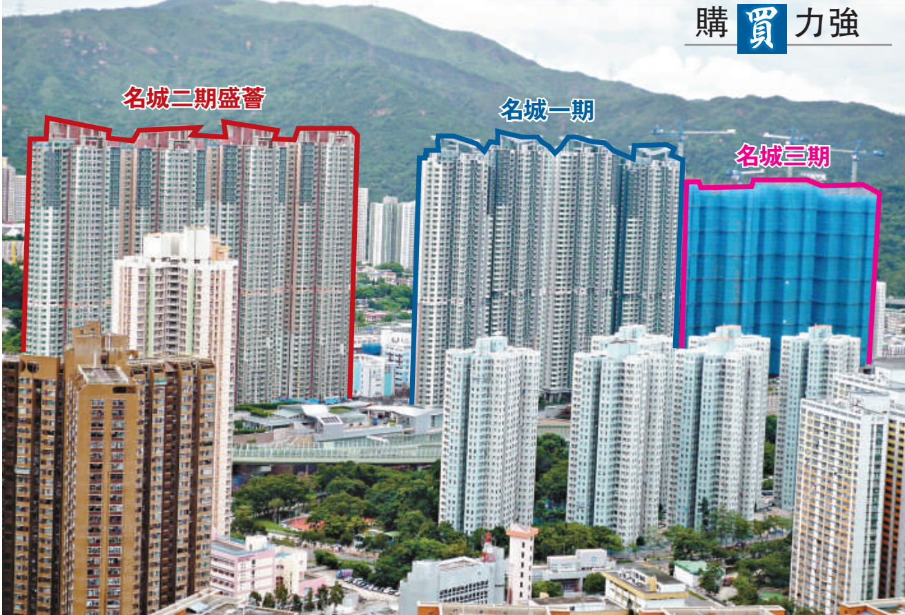
▲盛薈獲內地客大手洽購