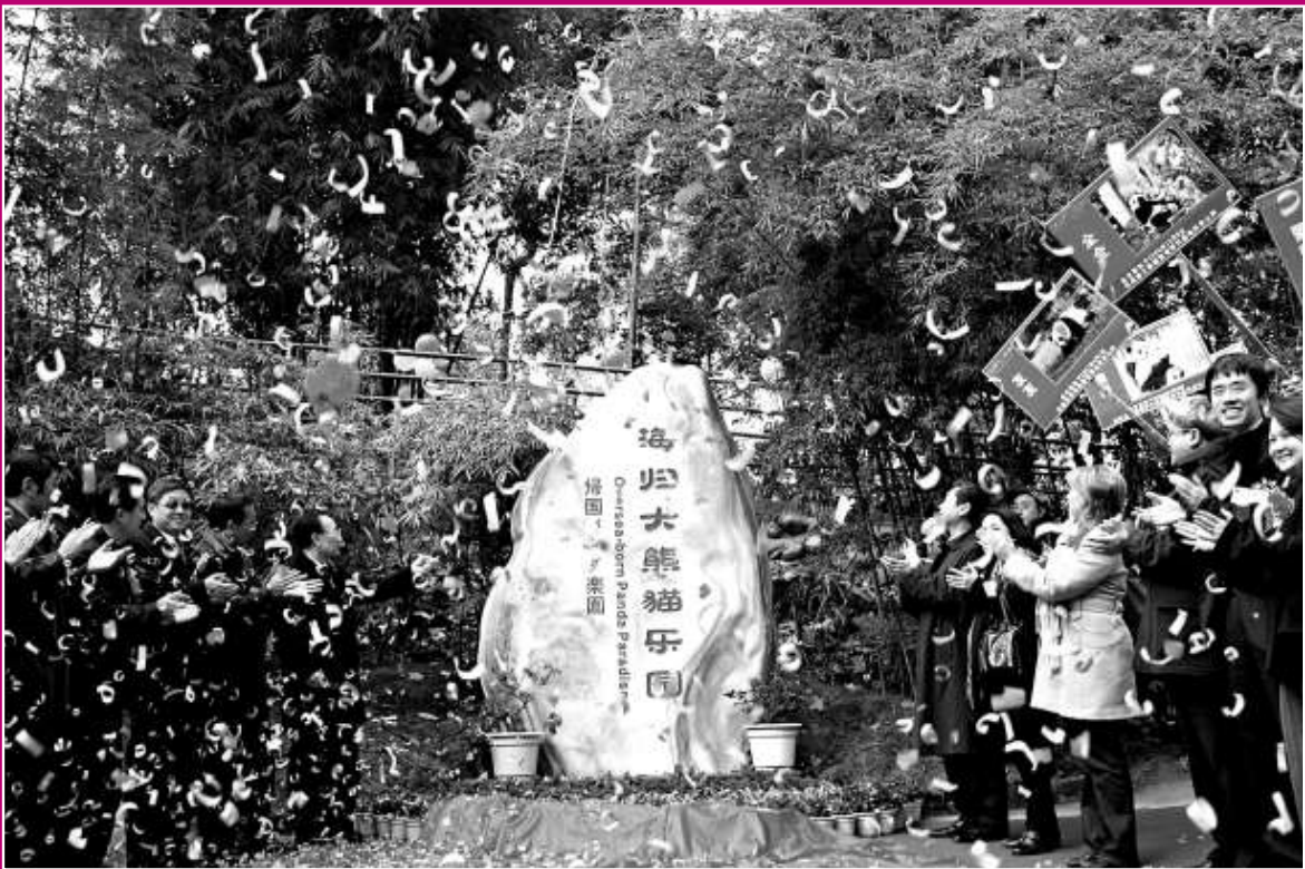
▲臥龍「海歸大熊貓樂園」19日在四川雅安落成。圖為國家及四川林業部門有關負責人為「樂園」落成揭牌。

生活在壓力如此大的都市裡，好趁一個休閒的午後，嘆一杯清茶，做一件讓自己得意的手工藝，既減壓又可以怡情養性，不失為一個休養心靈的好方法。