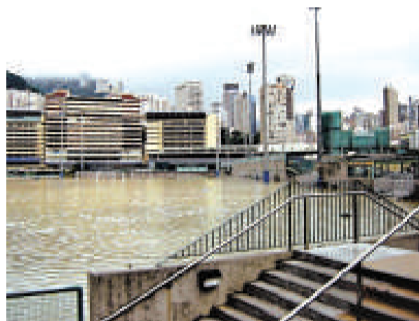
▲圖為08年跑馬地馬會內球場水浸情況，球場變澤國