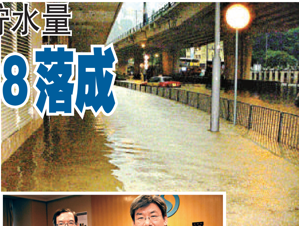
▲圖為08年黃泥涌道水浸