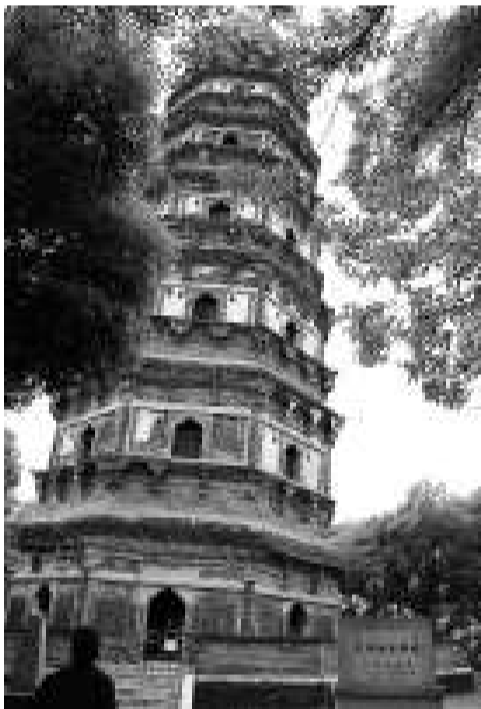
▲蘇州虎丘塔全稱虎丘雲岩寺塔，已有千餘年歷史

【本報訊】新華社南京21日消息：已有千餘年歷史的蘇州虎丘塔將迎來24年來首次全面「體檢」。記者今天從蘇州市區文物保護管理所獲悉，此次「體檢」歷時約一個月，目前虎丘塔已實行封閉檢測。