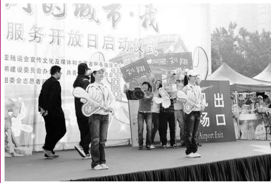
▲現場模擬文明志願者面對明星的到來始終堅守崗位，不為所動