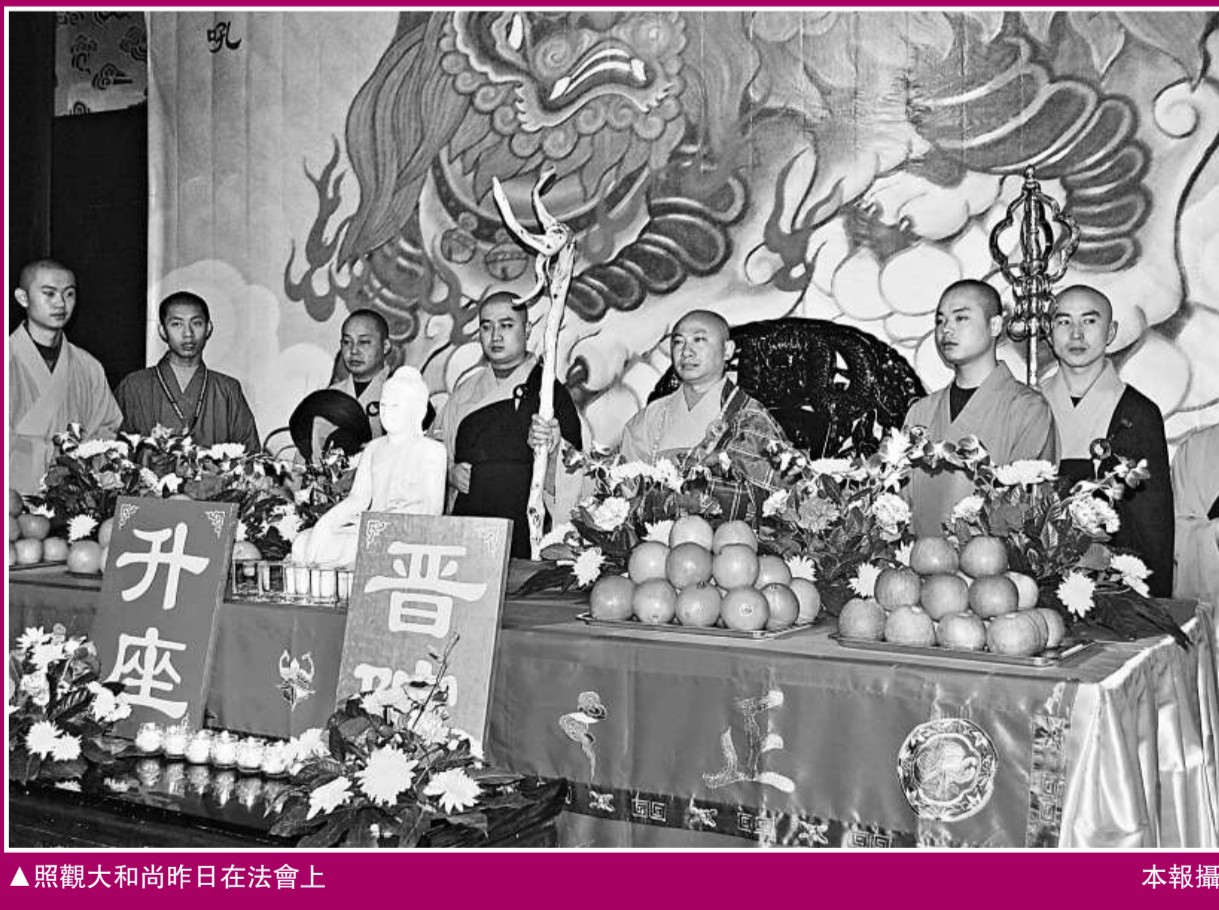
▲觀音大和尚昨日在法會上

由於歷史原因，凌雲寺自建國以來，法席一直虛位以待。根據中國佛教協會《全國漢傳佛教寺院管理辦法》和《全國漢傳佛教寺院住持任職退職的若干規定》的有關規定，2009年12月，經凌雲寺、烏尤寺兩序大眾協商推舉，國家、省、市佛協批覆，一致推舉禮請觀音大和尚爲凌雲寺、烏尤寺方丈，任期五年。