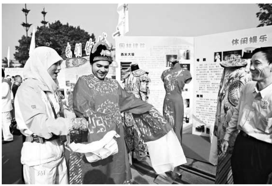
▲敘利亞友人「瀟灑哥」現場試穿中國龍袍，氣氛搞笑