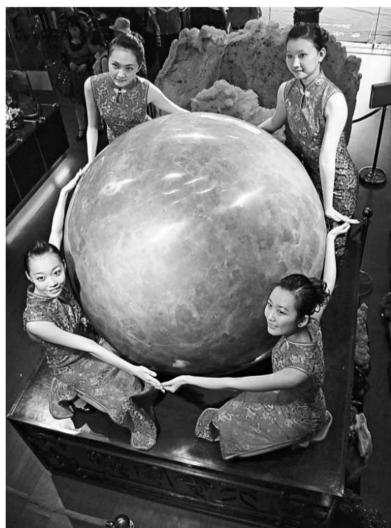
▲重達六噸，直徑1.6米，業內估計價值22億元的夜明珠，21日在海南文昌寶玉宮展出。圖為四名模特兒擁抱夜明珠

中國奇石珠寶協會副會長鄭寶石說，展廳內最吸引眼球的夜明珠，來自中國內蒙古，材質以炭石礦物爲主，發現時是不規則形狀，用三年時間加工而成現形。在關閉光源的黑暗環境中能發出晶瑩透亮的的光芒。