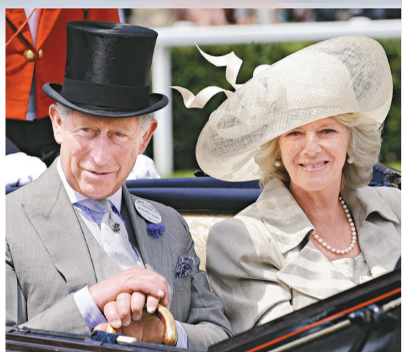
▲英國查爾斯王子和他的妻子卡米拉 資料圖片