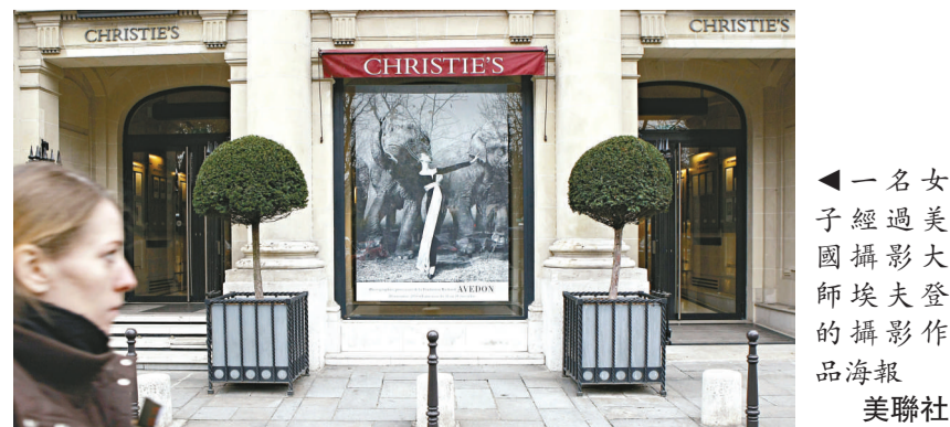
▲一名女子經過美國攝影大師埃夫登的攝影作品海報

的攝影大師，最擅長時尚攝影，曾為眾多當紅明星拍過寫真集。創紀錄的這幅圖片中，當年的名模多維瑪身着一套迪奧晚裝置身幾頭大象中間。拍賣行此前對它的估價為40萬至60萬歐元。法國媒體認為，這幅作品之所以拍出高價，不僅由於照片的超大規格，更在於作者本人對它的偏愛。埃夫登生前一直將這幅作品擺放在工作室。當天的拍賣會共拍出65張埃夫登的攝影作品，總拍價為550萬歐元。