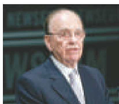
▲澳洲傳媒大亨梅鐸 資料圖片

他將是3名執行編輯之一。至於總編輯人選則仍未公布，但外界預計會由《紐約郵報》的執行編輯安杰洛出任。安杰洛是梅鐸長子拉克蘭的舊同學。而《紐約人》的前樂評人瓊斯可能會出任藝術及文化編輯。