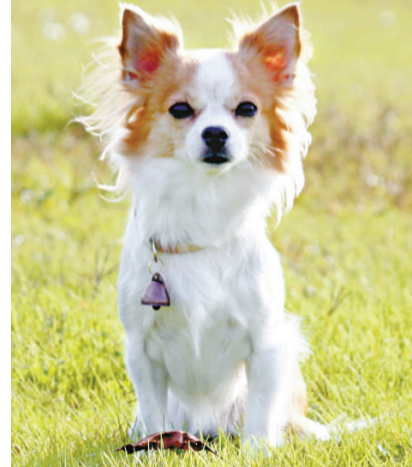
▲名為「桃子」的芝娃娃最近通過警隊的搜救犬測試

【本報訊】據路透社21日電：日本奈良縣大和郡山一雙7歲大的長毛芝娃娃犬，將會成為警犬，明年一月服役。這隻名為「桃子」的芝娃娃犬最近通過警隊的搜救犬測試，憑着嗅一下帽子的味道，5分鐘內便尋回了相關人士。據悉，70隻參與測試的狗當中，只有32隻合格，「桃子」是其中之一。警隊發言人表示，搜救犬在地震等大型災難就會出動，而「桃子」的優勢在於體形細小，大狗不能到達的地方，牠都可以去到。