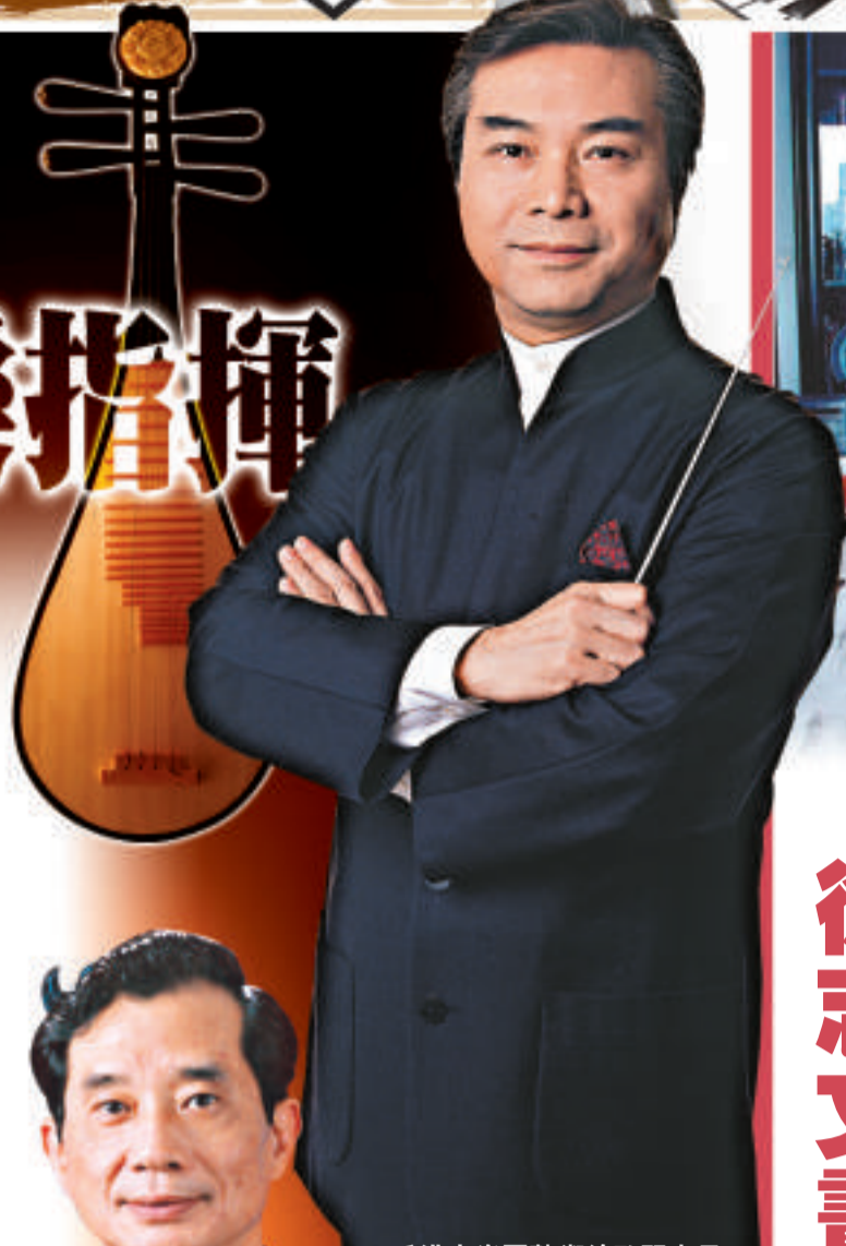
香港中樂團藝術總監閻惠昌