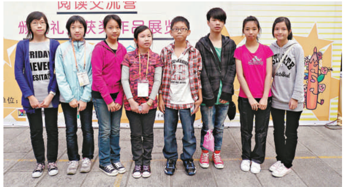
▲香港獲獎學生參加交流營