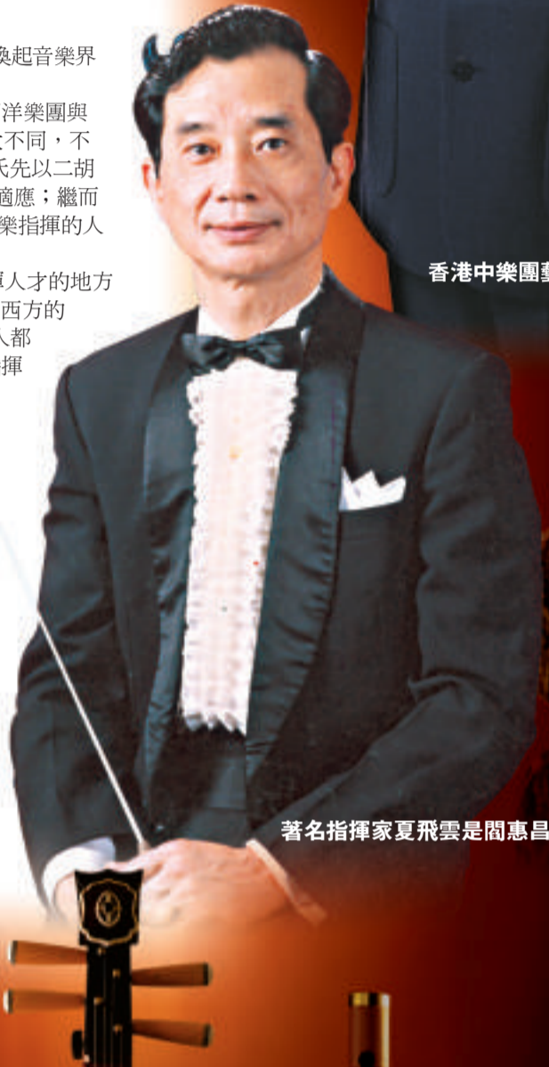
著名指揮家夏飛雲是閻惠昌的老師