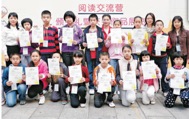
▲獲獎者手捧獎狀難掩喜悅