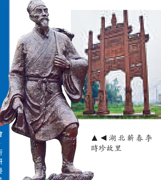
湖北蕪春李時珍故里

目前，世界各地開始認識及逐漸接受中醫藥服務，弘揚中醫藥文化，將有助促進中外文化交流，提高中華民族的國際影響力與競爭力。隨着中國經濟的高速發展，中醫藥文化愈來愈引起全世界的關注，中醫藥將伴隨着中國的強大而發展，伴隨着中華文化的傳播而走向世界。