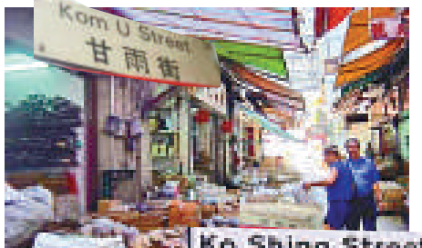
▲►香港是中藥材的主要轉口港和集散地

於煲湯和飲涼茶的傳統習慣上。日日煲，天天飲的湯水和涼茶其實也蘊含着「補」與「泄」這兩個中醫治療的基本法則。近年來，中醫藥事業在香港的發展令人鼓舞，中醫藥高等教育已有10年的歷史，中醫診所及服務已逐漸在香港醫療系統中發揮着重要的作用。