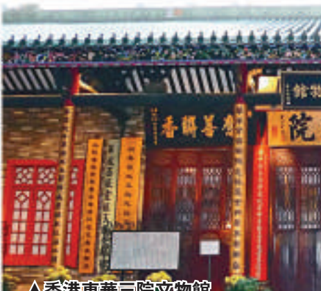
△香港東華三院文物館

中國近年雖說興建了一些富有中醫藥特色的校園、博物館與植物園，但從整體上看，似乎尚缺乏高水準，能夠與世界交流的園地。在西九文化區公園與博物館的建設中，中醫藥應當可以是濃墨重彩的一筆。引入中醫藥的元素，並從文化與生活的角度加以宣傳介紹，從一個獨特的側面展現中華文化的哲學思想與價值體系，和「人文西九」的理念相契合；另一方面，設計者可以應用新時代的新科技，以新途徑來展現中醫藥，使