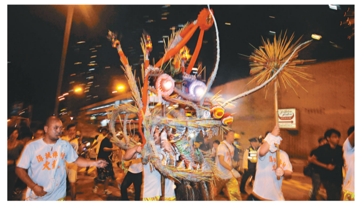
中秋節薄扶林舞火龍的盛況，80米長的火龍插滿長壽香，在龍鼓音樂配合下歡騰起舞

粵港澳三地年前已成功將涼茶和粵劇申報為國家非物質文化遺產，粵劇更獲聯合國教科文組織納入「人類非物質文化遺產代表作名錄」，成為本港首項世界一級非物質文化遺產。