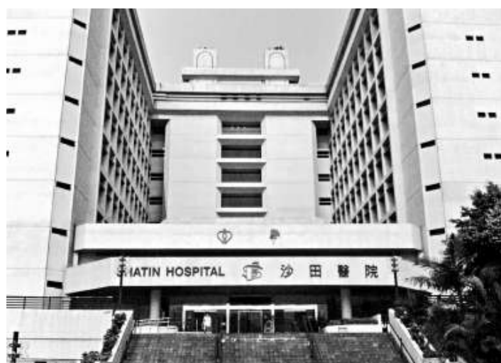
▲沙田醫院一名護士竟將未獲醫生證實死亡的病人送入殮房

【本報訊】本港公立醫院再次發生遺體處理失當事件。沙田醫院證實，於上週四早上，一名護士在沒有醫生簽署確認下，私自向病人家屬指稱病人已死，並將病人遺體送往殮房。醫院發言人表示會成立調查小組，兩星期內向醫管局提交報告。