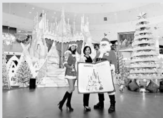
▲圖方豪華二千五百萬港元打造「夢幻聖誕」吸客