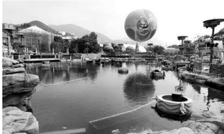
▲海洋公園新主題景點區「夢幻水都」將於明年一月開幕

新機動遊戲「翻天覆地」，並推出多項聖誕活動，期望聖誕入場人次按年增一成半至兩成。