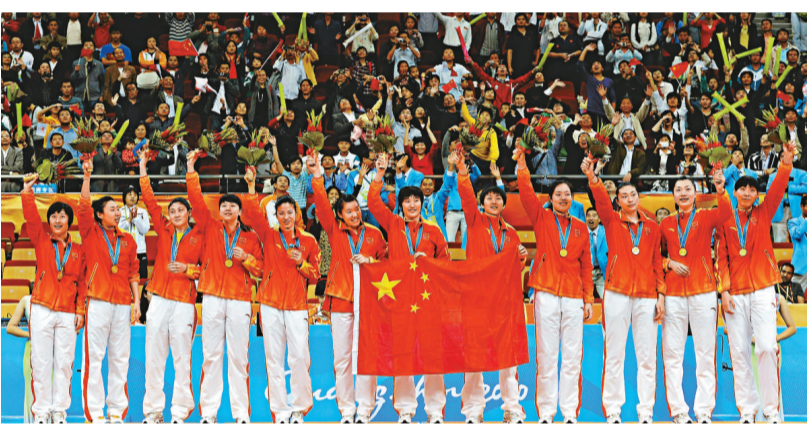
中國女籃姑娘們登上最高領獎台 法新社

【本報訊】據搜狐體育二十五日消息：25日晚，2010廣州亞運會女籃進入冠軍爭奪戰。在廣州國際體育演藝中心進行的比賽中，中國女籃以70：64戰勝韓國隊，喜獲五連勝的同時實現亞運會三連冠霸業，此外這也是中國隊歷史上第5次贏得亞運會女籃冠軍！這還是中國代表團在本屆亞運會贏得的首枚三大球金牌。