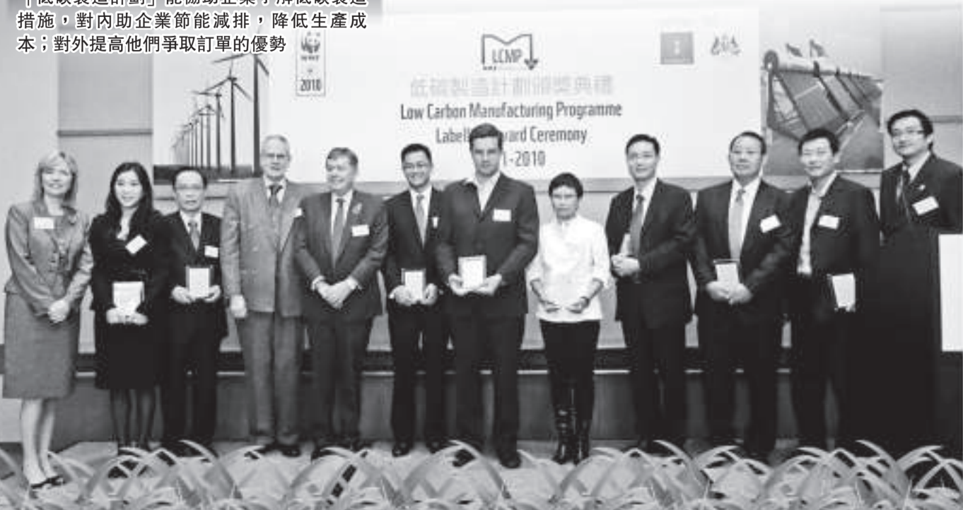
表合影 低碳製造計劃頒獎典禮上，主辦方與獲獎代表

你的廠房或供應商的廠房是否已就應對氣候變化、實踐低碳製造準備就緒？你可登入以下網址，回答十條問題，本會將於稍後為你提供分析結果。 wwf.org.hk/lcmp004