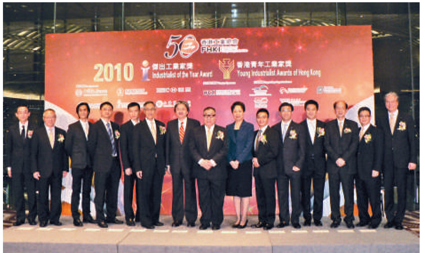
財政司司長曾俊華(左七)、中聯辦副主任郭莉(右七)與得獎者和工總領導合照

香港工業總會於1988年首次主辦「香港青年工業家獎」，其後於2002年增辦「傑出工業家獎」，以公開表揚一群取得卓越成就的工業家，並感謝他們對香港工業和整體經濟發展的貢獻。22年來，共有164位青年工業家獲頒「香港青年工業家獎」。