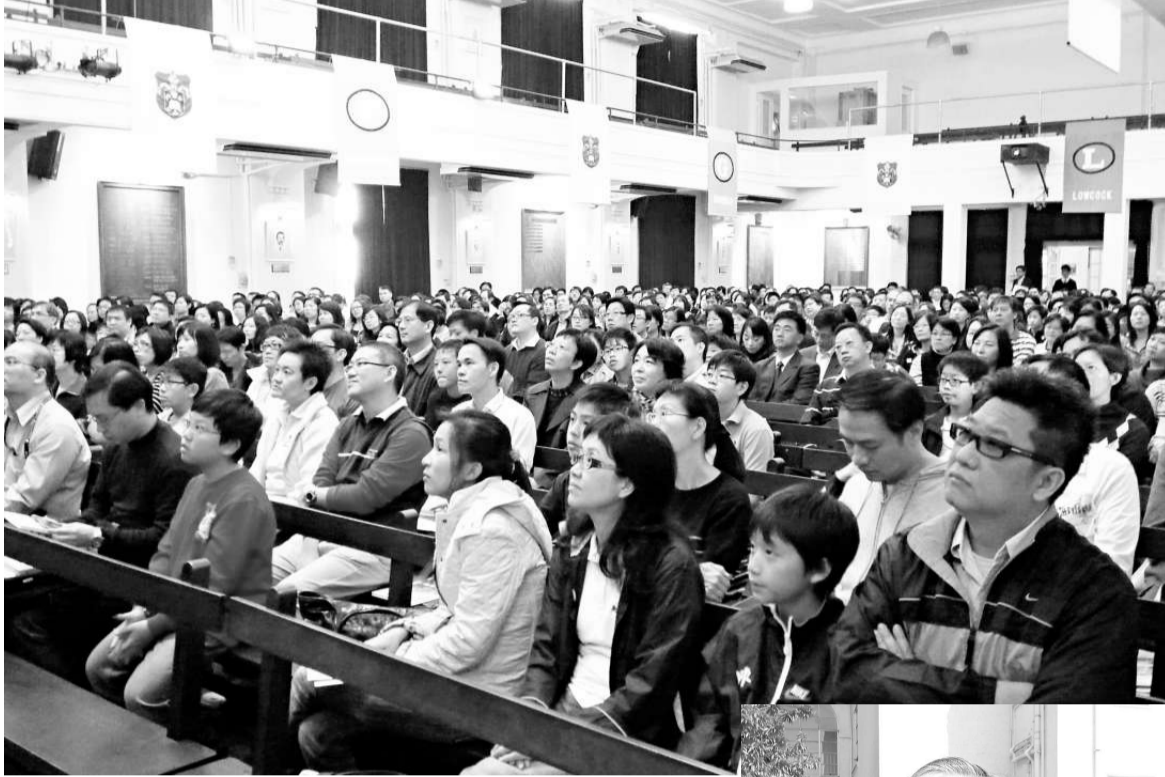
▲男拔每年的一小一簡介會都備受家長追捧。圖為男拔一小一簡介會

殺校「重災區」之一的大埔區七所中學已率先響應參與及聯署「簽約」。由中學校長組成的「聯席會議」預計，有過一百間中學表態有意自願減班，相信最終每區均有英中參加。另一「重災區」東區，有校長則預計區內十所開設五班的中學參與。至於同樣收生不足的元朗區，亦有二十多所中學認為方案可行，收到教育局通告後，稍後會與區內所有持份者溝通。