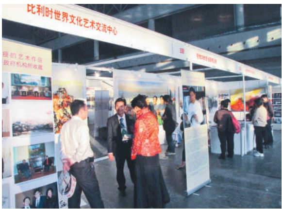
▲比利時世界文化藝術交流中心等多個華人藝術機構參展東莞藝博會