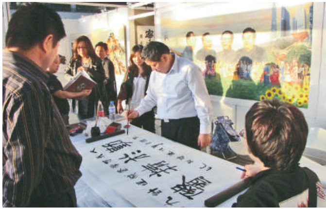
▲海外書畫家在現場揮毫

本屆博覽會展覽面積達到一萬多平方米，共設有五百多個展位，匯集了海內外五百多位書畫藝術家參與展覽和藝術交流，當中包括來自內地三十個省市和法國、英國、比利時、意大利、香港、澳門等二十多個國家和地區的書畫藝術家。除了展出書畫藝術精品之外，還設有玉器工藝品展區，展出珠寶玉器、奇石古玩、陶瓷紫砂、根雕石刻、紅木家具、工藝禮品、湖筆端硯、微宣圖書、茶品文化、蘇繡沉香等具有濃厚中國文化韻味的藝術品。藝博會負責人袁楚超說，由於這兩年玉器工藝品市場以及禮品市場非常火爆，因此本屆藝博會專門開設展區供藝術機構參展，此次展出一萬多件海外藝術精品，風格多樣，層次豐富。