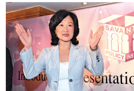
◀葉劉淑儀表示，組黨名單將會在明年一月才公布 資料圖片

【本報訊】匯賢智庫主席、立法會議員葉劉淑儀昨日表示，組黨名單將會在明年一月才公布。她透露，目前已有三百名成員，也有些知名人士。被問到是否邀請退出自由黨的田北辰加入，葉劉淑儀回應：「歡迎加入，最重要是願意參加直選，肯搏肯捱。」