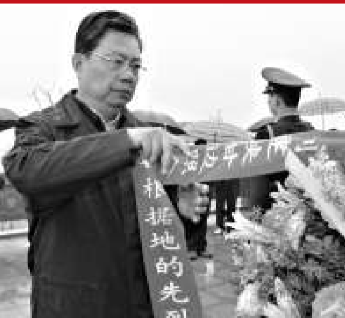
2010年4月20日，中共陝西省委書記趙樂際視察照金香山景區並向陝甘邊革命根據地英烈紀念碑敬獻花籃