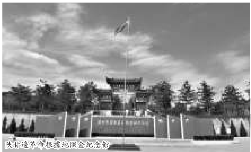
陝甘邊革命根據地照金紀念館

位於耀州區西北50公里處的照金鎮，屬陝甘交界的子午嶺南段。境內山巒綿亘起伏，間或有奇峰拔地崛起，為典型的丹霞地貌，溝壑縱橫交錯。照金鎮地勢雄險，自古就是一個屯兵秣馬之地，史傳周代、後秦均發祥於此。在中國革命史上，照金為中國革命的勝利做出了巨大貢獻。1933年劉志丹、謝子長、習仲勳等老一輩無產階級革命家以照金為中心，創建了西北地區第一個山區革命根據地，開展了一系列建黨、建政、建軍等活動，在這裡組建了中國工農紅軍第二十六軍，是西北紅軍成長壯大的搖籃。它的創立點燃了大西北革命的火焰，也為中國革命培養了一大批優秀人才。建於鎮區的照金革命紀念館佔地1100多平方米，館內收藏革命文物、文獻資料120餘件，真實再現了20世紀30年代以照金為中心的陝甘邊革命根據地創建、發展、鬥爭的全過程。