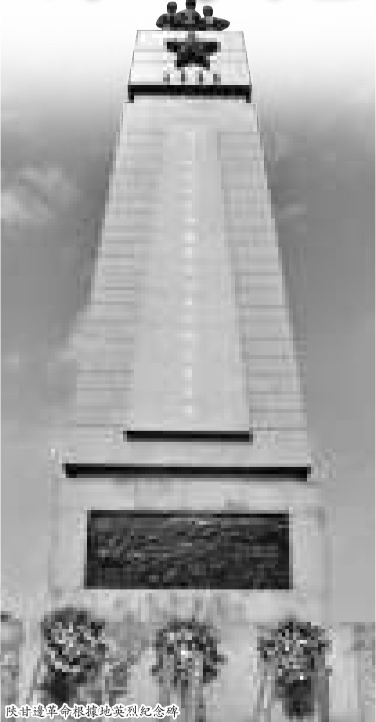
陝甘邊革命根據地英烈紀念碑