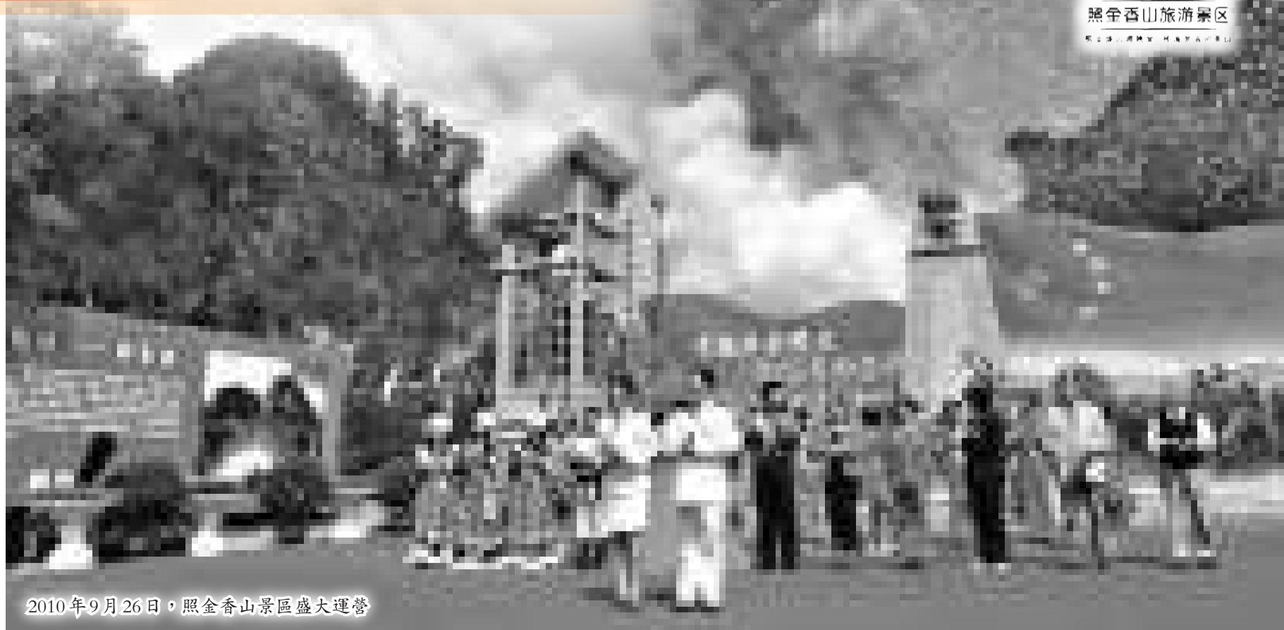
2010年9月26日，照金香山景區盛大運營

照金香山景區有着得天獨厚的旅遊資源，30萬耀州人熱忱歡迎各界人士到景區做客休閒、觀光旅遊、投資興業、共謀發展。「照金—香山景區」歡迎您的到來！