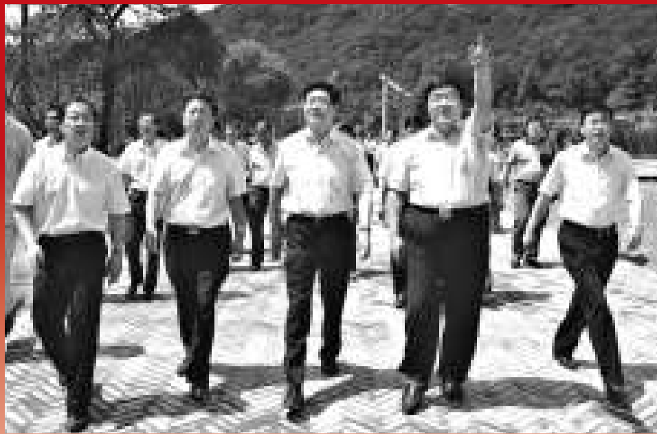
2010年6月18日，陝西省委副書記、代省長趙正永（前排中）在銅川市委書記吳前進（前排右二），市長馮新柱（前排左二），銅川市委常委、耀州區委書記馬秉寅（前排右一）、耀州區區長李志強（前排左一）等陪同下視察照金香山景區