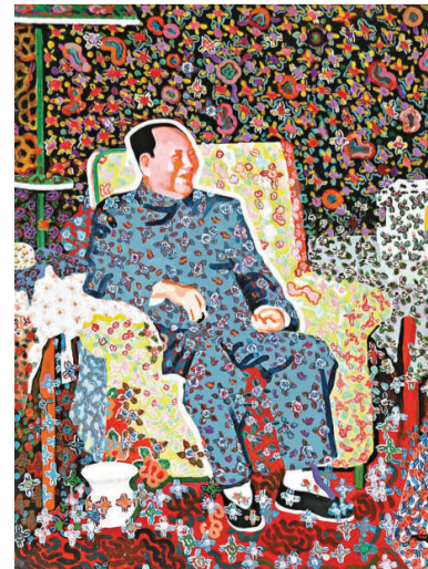
▲余友涵《毛主席》成交價六百一十四萬港元

近年中國買家崛起，尤其工藝品拍賣常達成天價交易，凸顯中國人雄厚經濟實力。另一方面，隨着