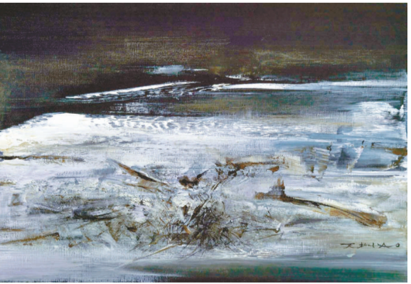
▲趙無極《18-7-62》成為昨日「中國二十世紀藝術」成交價最高作品