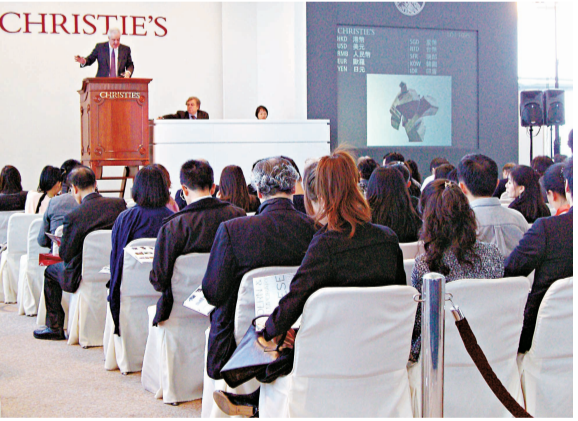
▲灣仔會展拍賣會現場