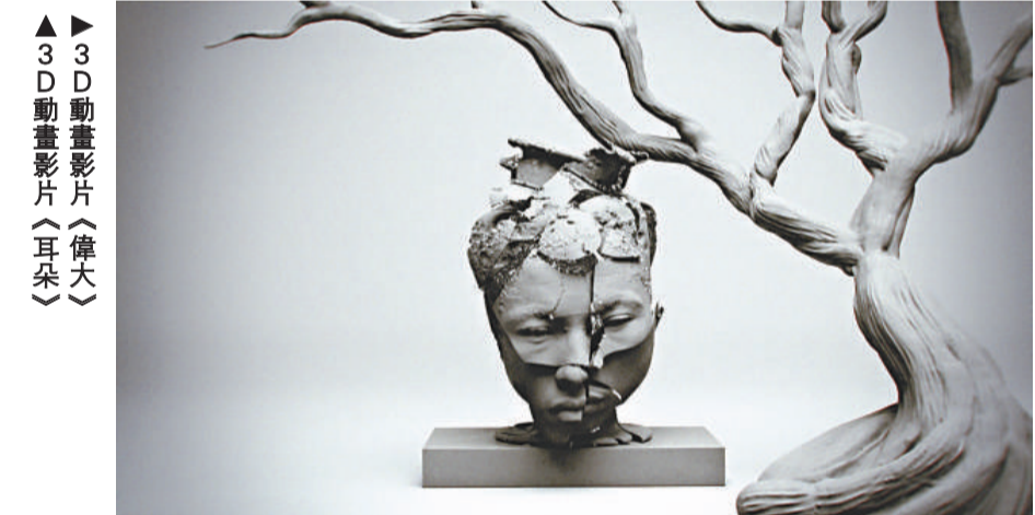
▲3D 動畫影片《偉大》 ▲3D 動畫影片《耳朵》