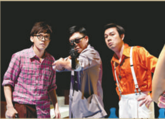
▲各人身份逐漸揭露，有人是黑社會頭子，有人更是殺手，要借此屋來狙擊目標