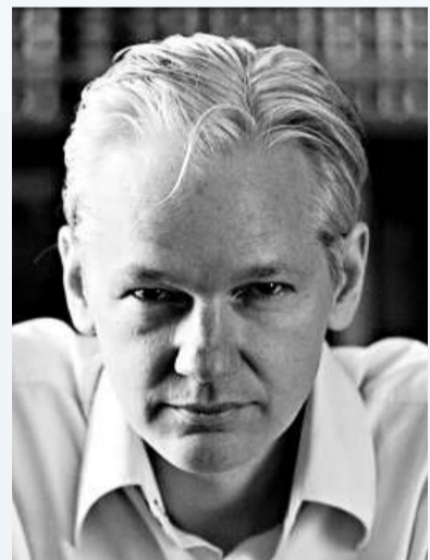
▲「維基解密」網站創始人朱利安·阿桑奇

這些文件已經上載到「維基解密」網站，並提供給美國《紐約時報》、英國《衛報》、德國《明鏡》周刊、法國《世界報》和西班牙《國家報》刊登。該網站揚言，未來數天會有更多文件和資料公開。