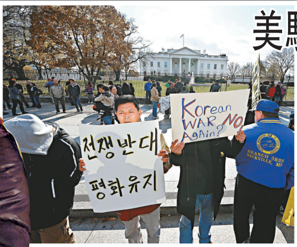
▲▲美國反戰人士27日在白宮外示威