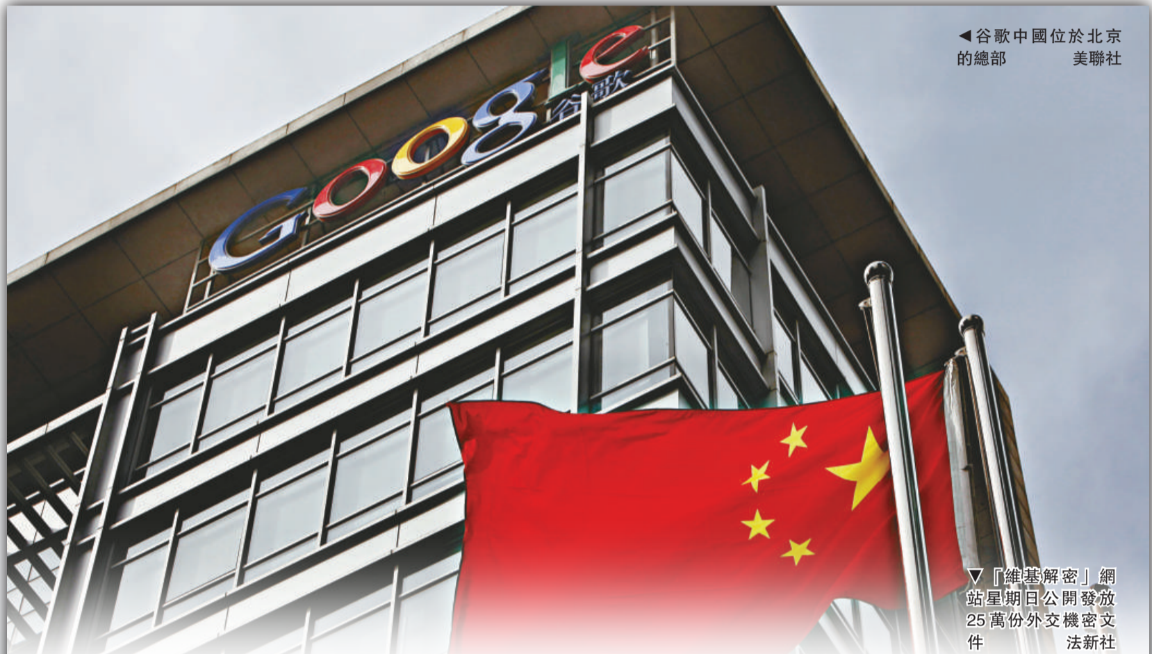
◀ 谷歌中國位於北京的總部

有關文件還提到，美國政府曾多次向中國官員表示關注，並列出至少十宗美方指稱朝鮮經過北京，向伊朗運送彈道導彈零件的事件。