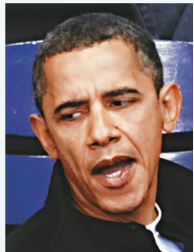
▲「維基解密」公開一批外交密件，令美國大為尷尬。圖為美總統奧巴馬28日公開亮相