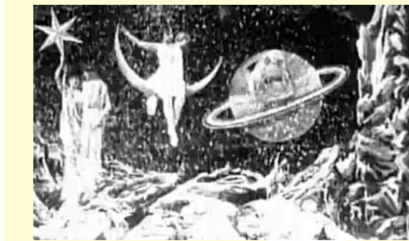
天文學家在月球遇上仙女和外星人