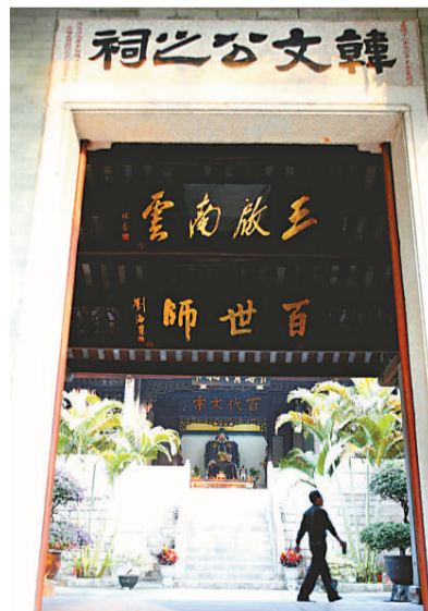
地處湖州的韓愈祠是中國現存歷史最悠久、保存最完整的紀念韓愈的祠宇