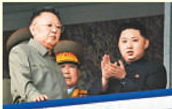
朝鮮勞動黨成立65周年慶典上，領導人金正日與三子金正恩(右)在主席台檢閱部隊

朝鮮，全名是朝鮮民主主義人民共和國，1948年由金日成成立。政治上，朝鮮是一個由朝鮮勞動黨一黨專政的國家，權力世襲，金日成逝世後，權力移交其子金正日，金正日又指定其子金正恩為接班人。朝鮮長期處於封閉狀態，鮮有國際外交，加上1950至1953年死傷枕藉的韓戰，以及天災人禍如1994年之後的大饑荒、美國對其實施經濟制裁等，使得朝鮮糧食嚴重短缺。韓戰後，朝鮮與蘇聯結盟，經濟上得到蘇聯支援，但自從蘇聯解體後，朝鮮頓失經濟支持，加上上述種種原因，使