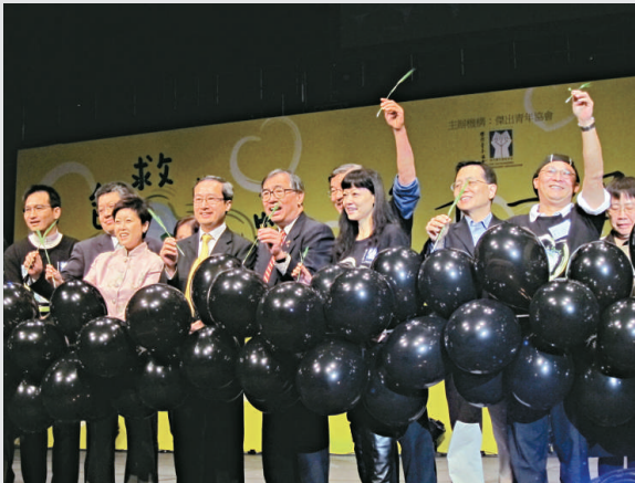
▲第十一屆明日領袖高峰論壇在港舉行

雖然真道家長會多番力挺，校董會聲明支持，但真道校方、校董會，包括校長、校監，仍欠公眾一個交代。因為，這是一間直資學校，中學學費由二萬六千至三萬元，只是非富則貴傳統名校的一半左右，但每年仍領取政府逾千萬元資助，這是公帑，由納稅人繳付。用公帑須受規範，行政手續要辦妥，先守規矩，才能談得上創新突破。未違法，不等於可以隨心所欲。這是事件的教訓。