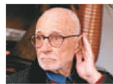
▲意大利著名導演馬里奧莫尼切利日前在羅馬自殺，享年 95 歲

馬里奧莫尼切利畢生一共執導拍攝了 65 部作品，被譽為意大利的喜劇大師，最著名的作品是《聖母街上的大人物》(I Soliti ignoti) 和《大戰爭》(The Great War)。(綜合報道)