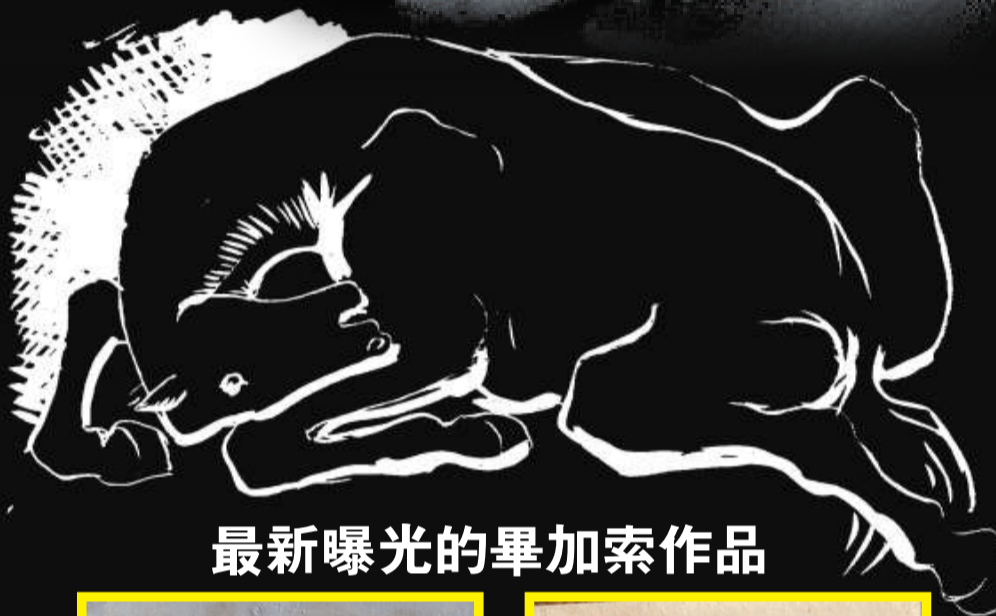
最新曝光的畢加索作品

勒蓋內克的代表律師里斯 29 日則對法新社說：「勒蓋內克先生說，如果他真的有偷東西，他又怎會自投羅網呢？」