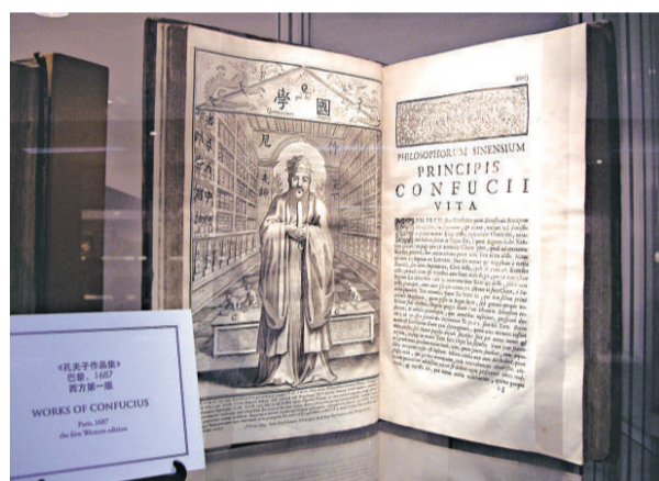
十七世紀出版的孔子《論語》西洋翻譯本初版

「第四屆香港國際古書展」在香港鐘古廣場一座五樓舉行，展期即日起至十二月五日，展覽詳情可查詢壹一公關顧問有限公司黎小姐，電話28015311。