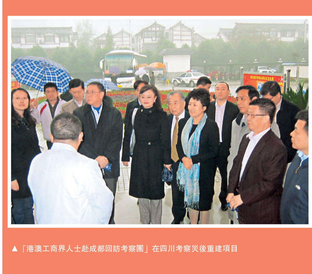
▲「港澳工商界人士赴成都回訪考察團」在四川考察災後重建項目