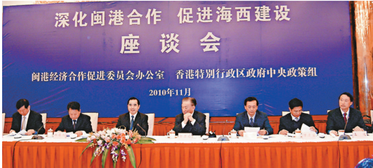
▲葉雙瑜主持由香港特別行政區政府中央政策組和閩港經濟合作促進會聯合舉辦的「深化閩港合作」座談會

【本報訊】日前，以香港特別行政區政府中央政策組首席顧問劉兆佳率領的中央政策研究人員暨有關專家學者一行24人，訪問了福建省福州、泉州、廈門市，受到福建省政府副省長葉雙瑜、閩港經濟合作促進會副主任鄒爾均、廈門市政府副市長黃菱、泉州政府副市長陳榮洲等有關省市領導會見。