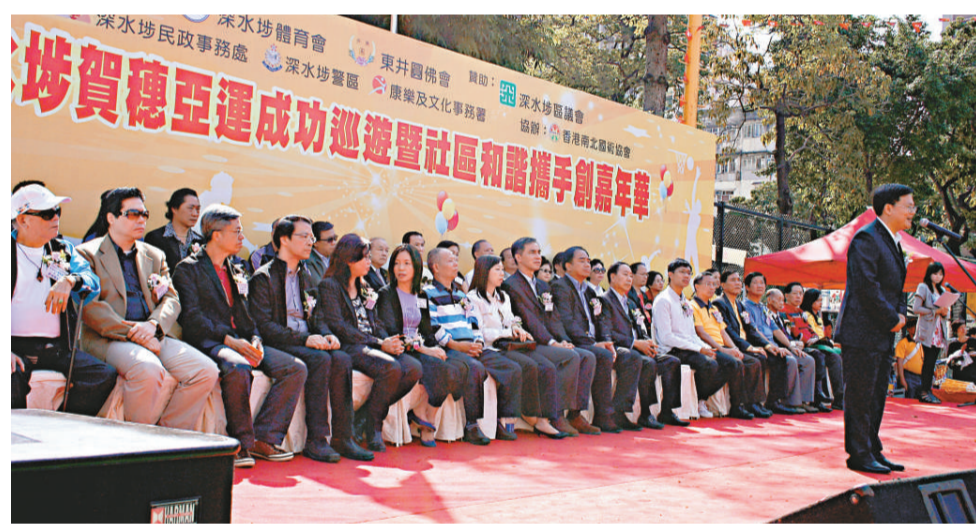
▲東井圓佛會賀穗亞運辦嘉年華

【本報訊】記者黃閩報導：為了推動深水埗街坊關心體育事業及恭賀廣州成功舉辦亞運會，東井圓佛會與深水埗體育會在日前合辦「賀穗亞運成功巡遊暨社區和諧攜手創嘉年華」。活動得到了深水埗區議會的贊助，以及深水埗民政事務處、深水埗警區和康樂及文化事務署等政府部門的配合。香港南北國術協會亦參與協辦，包括屬下三十多個團體參加。上千人參與巡遊，沿途經黃竹街、福榮街、石硤尾街、元州街、欽州街、長沙灣道、南昌街和鴨寮街等街道，讓區內居民分享到香港運動員獲取佳績喜悅的同時，亦可欣賞到具中華傳統文化的巡遊。