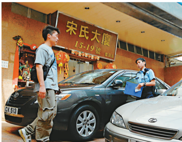
▲警員在發生刑殺案的工業大廈調查