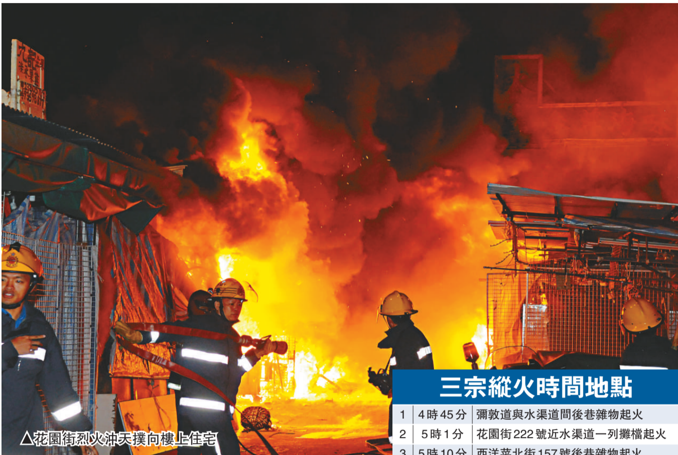
△花園街烈火沖天撲向樓上住宅

消防員在接報四分鐘後趕到，現場已一片火海，由於火勢猛烈，遂將火警升為三級。一些在水渠道撲救雜物縱火案的消防員，撲滅火勢後馬不停蹄，立即跑往花園街增援同僚。消防總共出動二百人參與救援，派出十六隊煙帽隊和動用八條喉救火。消防員登樓