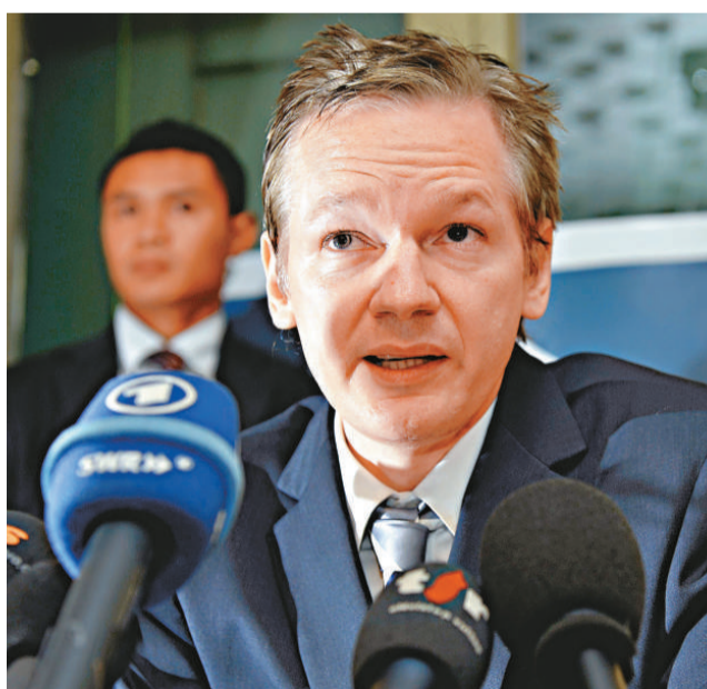
▲「維基解密」創辦人阿桑奇

斯蒂文斯還說，瑞典指控阿桑奇涉嫌強姦等罪名，是出於政治動機，背後動機就是把他送往美國。他擔心，如果阿桑奇被引渡至瑞典，最後將被送往美國。負責檢控其案件的瑞典檢察官則否認這說法，指兩件事完全獨立，沒有任何政治動機。