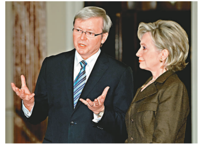
▲陸克文（左）曾告誡希拉里，應準備好必要時向華用武

他又說，澳洲與中國有廣泛深厚的經濟關係，中國是澳洲的最大貿易夥伴，有時兩國仍會就個別事件有分歧，但雙方關係依然穩固。密電顯示，陸克文在2009年3月與美國新任國務卿希拉里共進午餐時，形容自己在中國問題方面是一個「殘酷的現實主義者」。這份密電是希拉里在午餐後寫的一份署名備忘錄，文中詳細記錄了她和陸克文在午餐期間的談話。希拉里對陸克文透露，美國對中國的迅速崛起以及中國所掌握的巨額美國外債感到擔心和恐懼。她向正在美國訪問的陸克文討教要如何用強硬手法應對中國這個債主。能說流利普通話的陸克文告訴希拉里，國際社會應該用發展雙邊關係的動頭與中國開展多邊接觸。陸克文表示，儘管與中國接觸的最終目標是「讓中國更有效地融入國際社會，允許它承擔更大的國際責任。但同時也要做好一旦局勢惡化不惜使用武力的準備。」