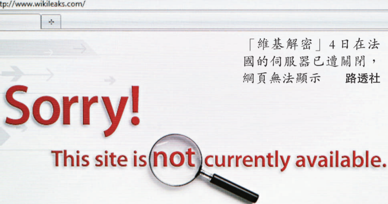
「維基解密」4日在法國的伺服器已遭關閉，網頁無法顯示

【本報訊】據英國《泰晤士報》網絡版五日報導：爆料網站「維基解密」與美國之間的糾紛4日轉趨激烈。該網站公布了一份據稱對美國「國家安全至關重要」的清單，詳細列出了美國在全球範圍內的多處重要設施，涉及輸油管道、海底電纜和工廠等。安全專家擔憂，這份清單此舉很可能為恐怖分子襲擊美國提供絕好的目標。