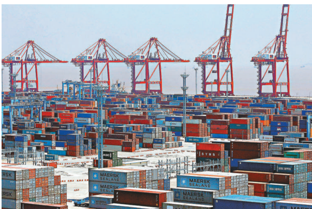
▲位於中國東南部的寧波港亦被列在此次遭曝光的重要設施清單中

「維基解密」最新的爆料遭到英國前外相及國防大臣葛偉敬的批評。葛偉敬認為，「維基解密」公布這份名單，可能會令它們成為恐怖分子的襲擊目標，此舉是