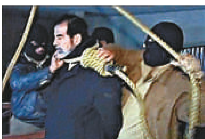
◀有人用手機拍下薩達姆的行刑過程，然後上傳至互聯網 資料圖片

被泄的電文說，在管理觀刑者的秩序上和行刑上，伊拉克政府都缺乏清晰的部署，行刑的過程匆忙而混亂。觀刑者名單竟然經過數次改動，人數一度有20至30人。