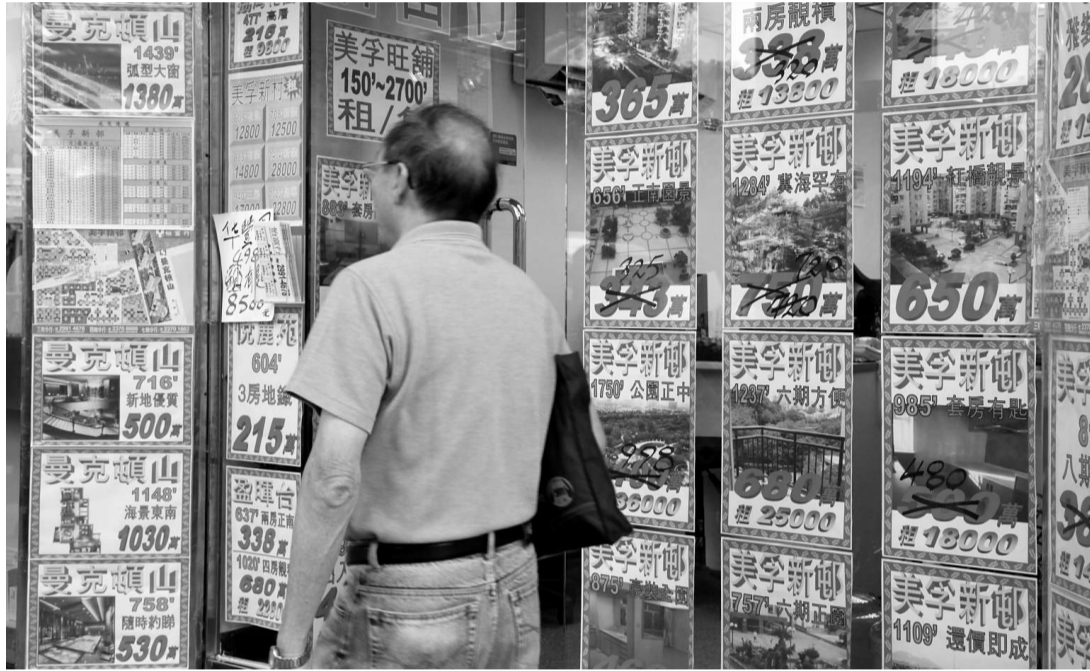
上月港府以最高百分之十九點五印花稅打擊住宅物業短線炒賣活動，效果可說立竿見影