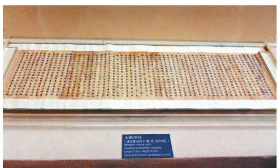
▲大般涅槃經（南北朝）