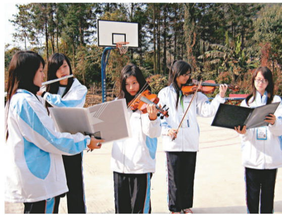
▲香港學生回敬幾首西方樂曲