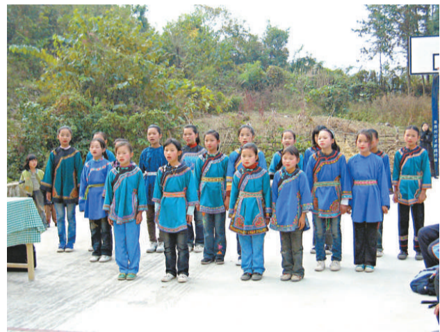
▲荔波小學的女學生演唱水歌

上午九時許，「香港青少年中國民族民間文化藝術研習考察計劃」啟動儀式在水利大寨露天操場舉行，這項活動由中國民族民間文化藝術交流協會主辦，國家文化部民族民間文藝發展中心及香港中樂團協辦，並得到國家文化部港澳台辦公室及教育局支持。國家文化部對這計劃非常重視，文化部港澳台辦公室副主任侯湘華、文化部港澳台辦公室港澳處處副處長楊曉龍從北京到此出席了啟動儀式。