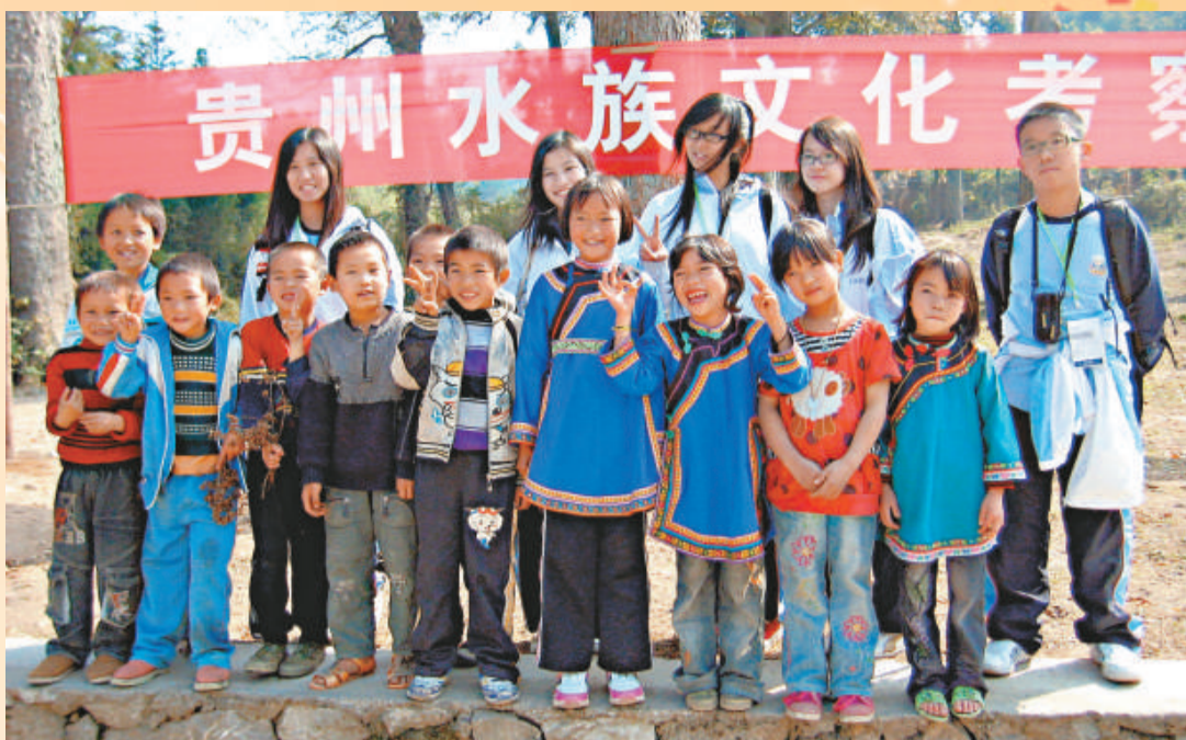
▲香港學生很快與水利大寨活潑純真的小朋友們打成一片 ▲參加啟動儀式的師生、嘉賓、水利大寨村民代表來個大合照