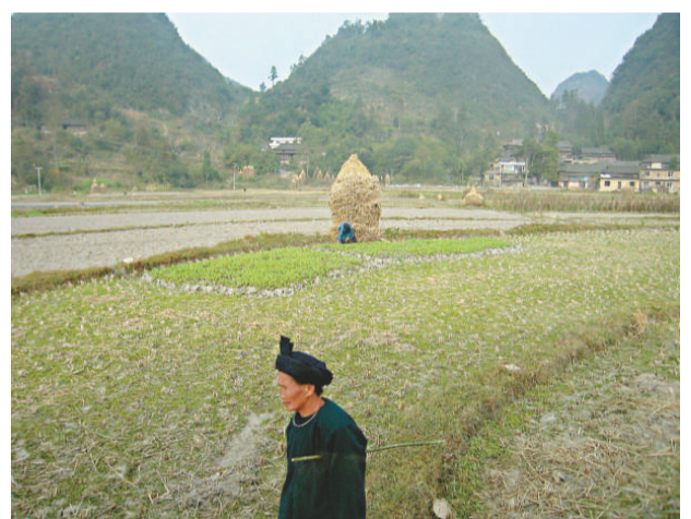
▲水利大寨依山而建，村民主要務農為業