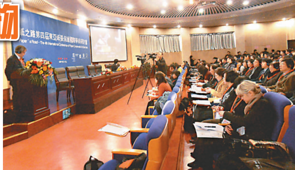
▲「紙之路」——第四屆東亞紙張保護國際學術研討會現場