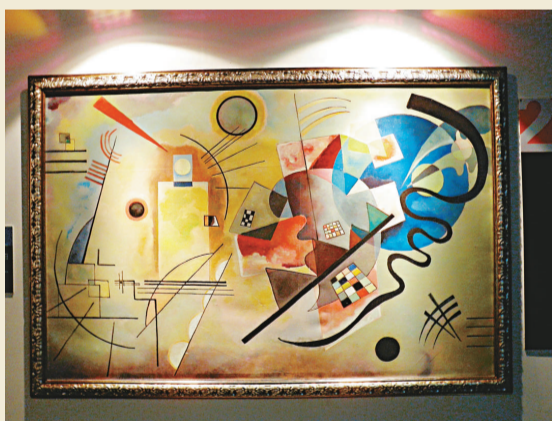
▶一九二五年康定斯基的抽象作品《黃紅藍》