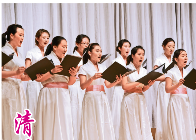
香港演出 ▶無伴奏合唱清唱劇《桃花扇》將在