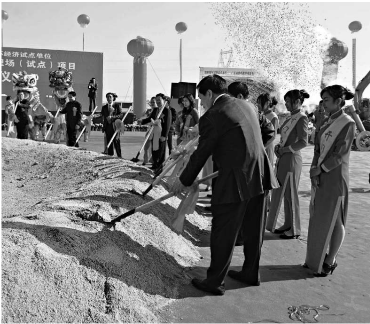
▲貴嶼廢棄電器電子產品集中處理場項目奠基現場