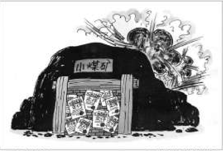
▲河南省澠池縣的巨源煤礦瓦斯爆炸事故，又一次把煤礦主的肆無忌憚暴露在人們面前

也一直在現場。礦方組織人員下井時，這名幹部親自清點過人數，對下井人數很清楚，但他卻始終一言不發。直到8日早上，救援指揮部人員問他時，他竟然作出「沒人問我」的滑稽回答。目前，這名礦幹部被公安部門羈押。