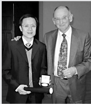
黃維揚(左)獲英國皇家化學會頒發二零一零年過渡金屬化學獎

【本報訊】香港浸會大學化學系教授黃維揚，獲英國皇家化學會頒發二〇一〇年過渡金屬化學獎，成為首位獲頒此殊榮的華人。該獎項表揚他在金屬共軛聚合物合成研究方面的卓越表現，包括太陽電池和光限幅器的研發和應用上的貢獻。黃維揚研究為高效有機太陽電池和發光器件的發展提供嶄新的材料，繼而提高節省能源的技術。他表示，對獲獎感到榮幸，將繼續帶領研究團隊致力提高發光器件的性能和耐用性，未來將會致力研究開發可持續能源，改善能源轉換的技術，從而研發環保的再生能源，解決世界能源及環境問題。其研發的物料嘗試應用於有機薄膜電晶體、生物醫學和納米技術等。黃維揚主要研究領域包括合成無機、金屬有機化學和結構化學等，特別致力研發新的分子功能材料及金屬有機聚合物。他研發的金屬乙炔類聚合物和金屬磷光材料亦引起國際科學界的廣泛關注，這些新型材料可供廣泛應用，包括雷射光感測器及保護眼鏡、太陽能電池和有機發光二極管的光電信號轉換器和磁性金屬合金納米粒子的前體化合物。英國皇家化學會為歐洲最具規模的化學學術機構，以推動化學學術、應用和研究發展為宗旨，每年均會表揚世界各地有卓越貢獻的化學家。