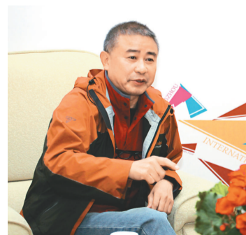
作品的拍攝理念 《劫後》導演舒崇福介紹