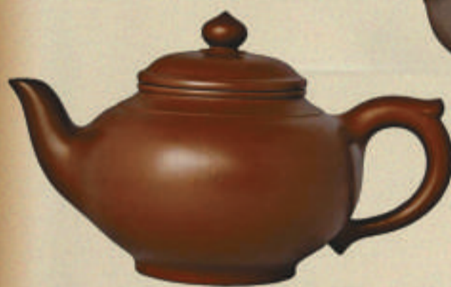
▲《六方一捆竹》 ◀《笑櫻壺》

格外引人注目。錢建生說，那是在進入二十一世紀時創作的。許多人選擇去寺廟、廣場敲打世紀之鐘，許下新世紀的心願，他便以此獲得靈感。創作中以「鐘」為壺身，降坡泥的材質更富有歷史感，壺鈕設計成龍形，寓意龍的傳人，壺蓋上和邊沿處，用五十六朵牡丹花環繞。牡丹是中國傳統名花，富麗堂皇，國色天香，自古就有富貴吉祥、繁榮昌盛的寓意，代表中華民族泱泱大國之風範，而選擇五十六朵，也寓意五十六個民族緊密相連，團結一致。在壺身底部，設計成了長城狀，可看作台階，也可看作烽火台。一圈如意紋圍繞，也是五十六個，與壺體頂部的五十六朵牡丹呼應，祝福中華五十六個民族吉祥如意，萬