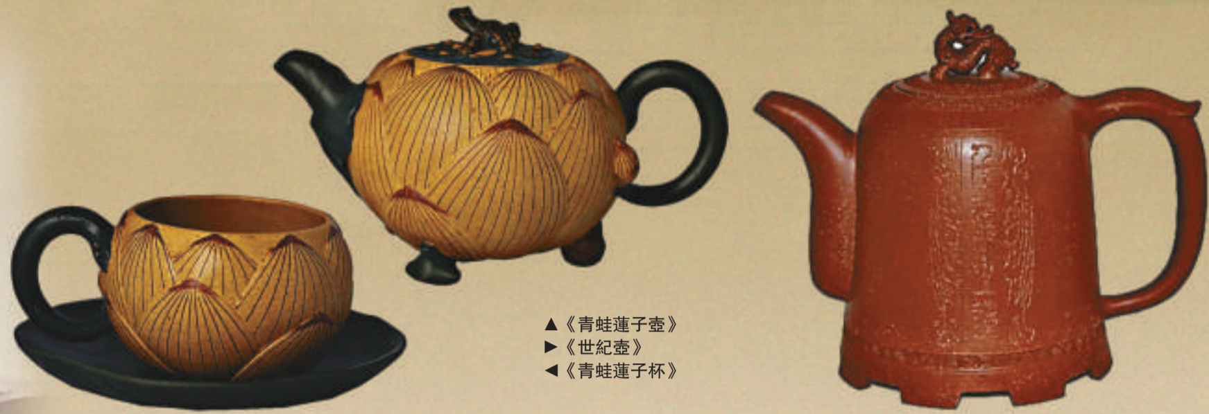
▲《青蛙蓮子壺》 ▶《世紀壺》 ◀《青蛙蓮子杯》