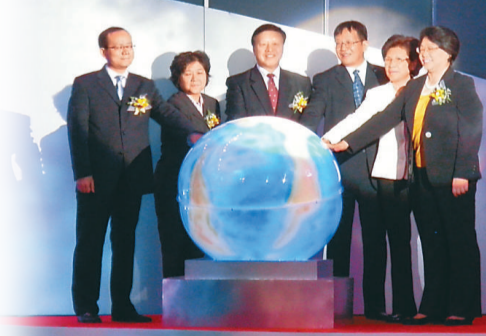
▲ 出席閉幕晚會嘉賓主持啓動儀式