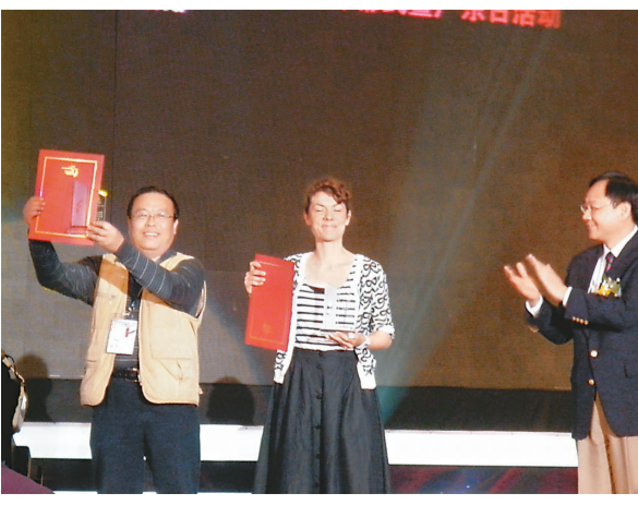
▲ 在本年度評展展播活動中獲得獎項的部分導演上台領獎