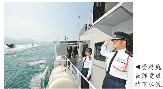
▲警務處處長鄧竟成主持下水儀式

【本報訊】香港警隊水警總區在數年前開始逐步引入更小型、更快速的船艇，配備嶄新和先進的中央指揮系統，令水警可以更快、更靈活地執行日常任務和處理突發事故，大大加強香港警隊的海上執法能力。 警務處處長鄧竟成昨日在西貢大廟灣為五艘中型巡邏警輪和六艘分區快速巡邏艇主持下水儀式致辭時作上述表示。他說：「面對香港和珠三角水域的快速發展和融合，我們需要確保香港警隊有足夠能力去應付各方面的新挑戰，當中包括港口和離島的設施，以及連接珠江三角洲的各條新通道。」 中型巡邏警輪船長十九米、闊五米、吃水為一米；由三台噴射系統推動，船速可達四十五海里。巡邏警輪配備先進儀器，包括差分全球定位儀、測深器、雷達、電子海圖及衛星羅盤。船上駕駛室之特點是具備三百六十度視野，工作人員能清楚觀察海上船隻之活動。分區快速巡邏艇則船長約十一米、闊二點五米、吃水為零點六米；由兩台二百七十五馬力的舷外機推動，船速可達五十海里。這批新船艇會取代自八十年代初服役至今的「達文三型」及「港口巡邏」警輪。