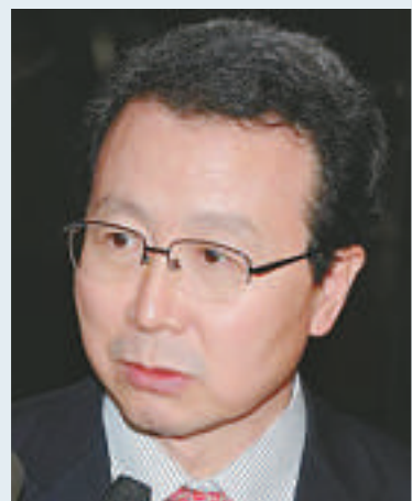
▲中國駐日本大使程永華指，美日韓應尋求與朝鮮直接對話

而有關中國海軍積極活動的說法，程永華聲稱，這不是敵視日本的行動，只是為了訓練，不該受到指責。