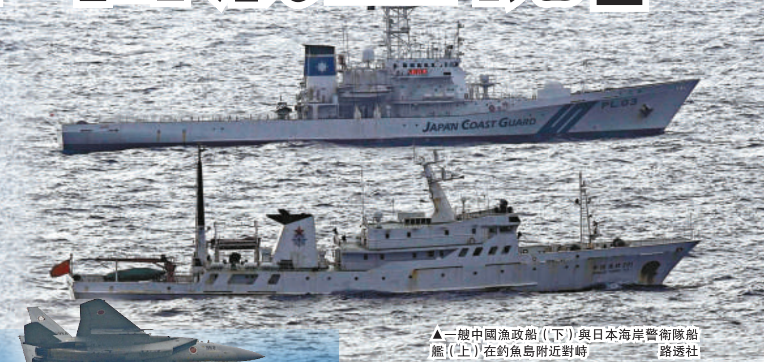
▲一艘中國漁政船(下)與日本海岸警衛隊船艦(上)在釣魚島附近對峙

另據日本共同社報道，日本內閣各成員10日用一個漢字總結2010年，防衛相北澤俊美針對中日撞船和朝鮮炮擊等事件，選了「島」字。