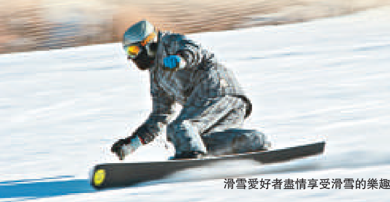
滑雪愛好者盡情享受滑雪的樂趣

購物： 著名的口蘑、蕨菜、貢米、大杏扁、白葡萄、葡萄酒、蔚縣剪紙、鸚鵡綠豆等都盛名遠揚。