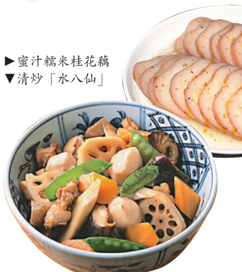
蜜汁糯米桂花藕 清炒「水八仙」