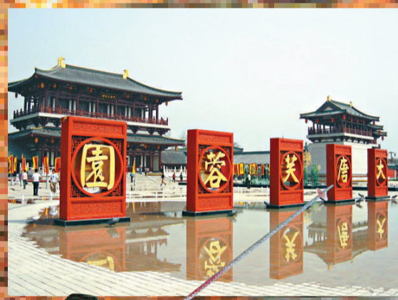
大唐芙蓉園仿照唐代皇家園林式樣建造

旅遊TIPS： 從西安火車站乘5路公共汽車至和平門換乘游4公共汽車即可抵達；或在南門乘曲江旅遊巴士直達。