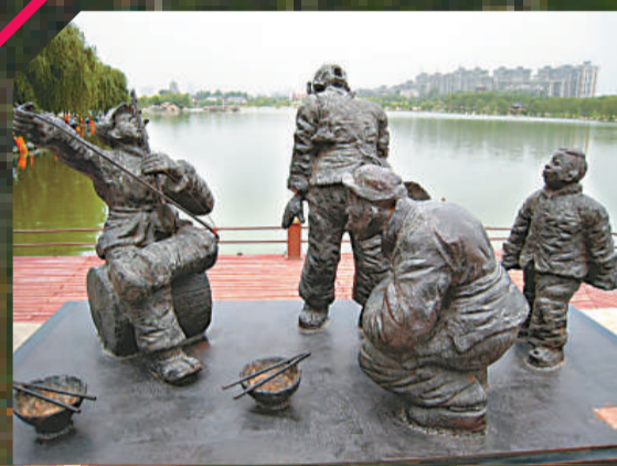
芙蓉園內的陝西風土人情雕塑

據主辦方負責人介紹，比賽分為中文和英文兩個賽場，共設導遊風采、導遊講解、知識問答、才藝展示、情景再現五部分。大賽將選出一、二、三等獎共35名獲獎者和最佳素質獎、最佳語言才能獎、最佳講解獎、最佳風采獎、最佳才藝獎5個單項獎。