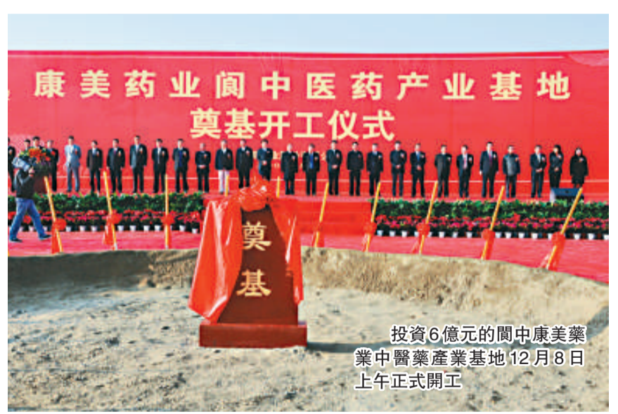
投資6億元的閬中康美藥業中醫藥產業基地12月8日上午正式開工。

投資6億元的閬中康美藥業中醫藥產業基地12月8日上午正式開工。全國人大常委會原副委員長蔣正華、國家中醫藥管理局副局長于文明、四川省人大常委會辦公廳黨組成員、機關紀檢組長張力，廣東證監局局長侯外林、普寧市委書記杜小洋、康美藥業董事長馬興田、南充市市長高先海以及閬中市委書記蒲芝龍、市長蔣建平等出席了奠基儀式。 康美藥業是全國中藥藥片行業的龍頭企業，根據公司與四川省閬中市政府之前簽訂的《閬中中醫藥產業投資暨股權收購協議》，在完成股權收購滕王閣製藥有限公司和保寧製藥有限公司後，並以這兩家公司為主體在閬中投資建設中醫藥產業項目。這一基地正式開工，表明康美藥業在四川閬中的項目進展十分順利。 閬中方面對這一項目十分重視，市委書記蒲芝龍認為這是閬中的一號