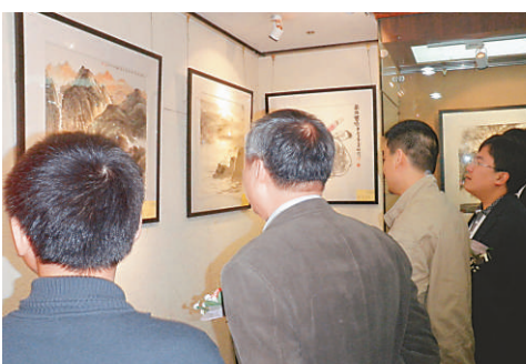
▲觀眾在展覽現場觀賞作品