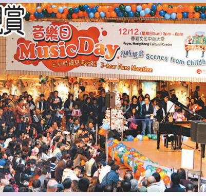
▲逾千市民欣賞鋼琴馬拉松表演

「音樂日」鋼琴馬拉松長達三小時，由二十九名來自香港演藝學院的鋼琴新星，接力彈奏舒