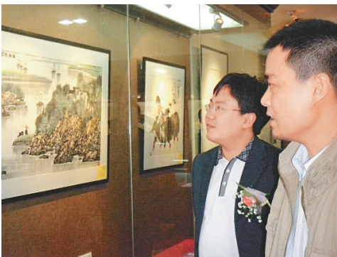
▲名家作品邀請展來自全國六十位書畫名家手筆