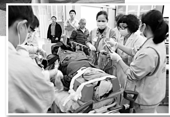
▲在車禍中受傷的民眾被送醫急救。中央社

▲阿里山鄉達邦公路12日發生3死、8重傷，及多人輕傷的車禍意外，肇事的遊覽車扭曲變形，可見當時撞擊力道強大。中央社