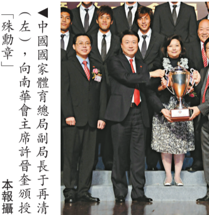
▲中國國家體育總局副局長于再清(左)向南華會主席許晉奎頒發「殊勳章」

許晉奎稱：「徵求會員運動已有94年的悠久歷史，每年均成功為本會招募到大量會員，今年徵求會員運動成績令人十分滿意，各組別競爭激烈，成績亦非常接近。」