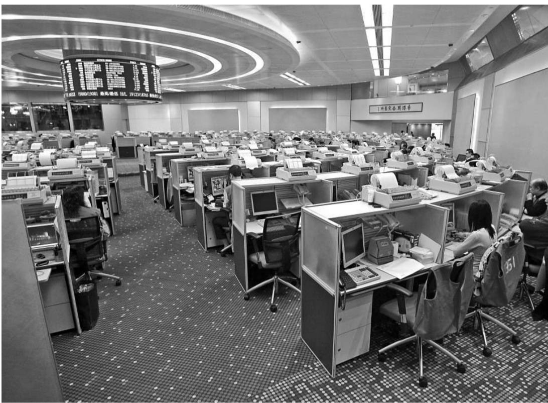
恒指上周跌157點,平均每日成交額萎縮超過百億至732億

大摩重估渣打2010年至2012年盈利預測,降低4%至6%,主要反映較低的撥備前利潤。維持「同步大市」評級,目標價由246元降至235元。