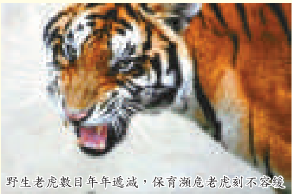
野生老虎數目年年遞減，保育瀕危老虎刻不容緩

老虎是體型最大的貓科動物。19世紀後，人類活動令老虎的棲息地縮小和分散，現時老虎的棲息地較10年前少40%，加上捕獵者不斷獵殺老虎以取得皮毛、虎骨以及用作補身的器官作貿易買賣，使得野生老虎的數目不斷減少。20世紀初，全球野生老虎約10萬隻，現時僅得3000多隻，散布於印度至中國東南部，以及由俄羅斯至蘇門答臘的森林。老虎在亞洲區的境況堪虞，以往中國東北部有近1000隻西伯利亞虎，近年只剩下不多於20隻，印度2001年有3700隻老虎，現時僅剩1300隻。