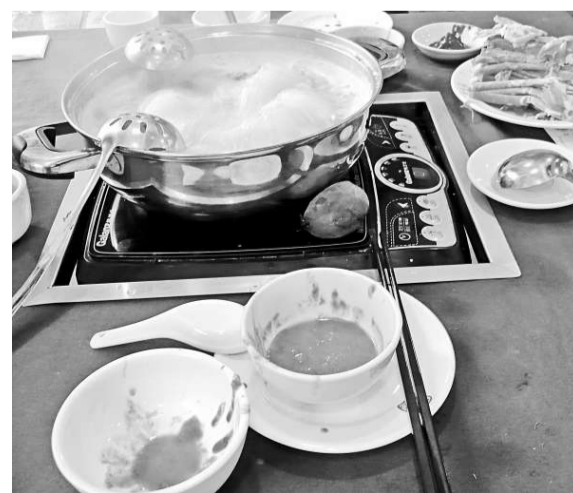
▲內地火鍋調料傳聞使用化學添加劑，但政府執法部門卻無從監管

中國社科院上周發布「住房綠皮書」指出，因購房者多數認為房價過高，市場觀望情緒漸濃。今年住房租金出現了較大上漲。今年第二季度全國房價漲幅下降，但租金卻大幅上揚，全國住宅租賃價格指數同比上漲10%，第三季度同比再漲12.1%。北京同比上漲高達18.2%。住房租賃者支付房租激增，承租壓力日重。部分住房消費者陷入「買不起」兼「租不起」的困境。