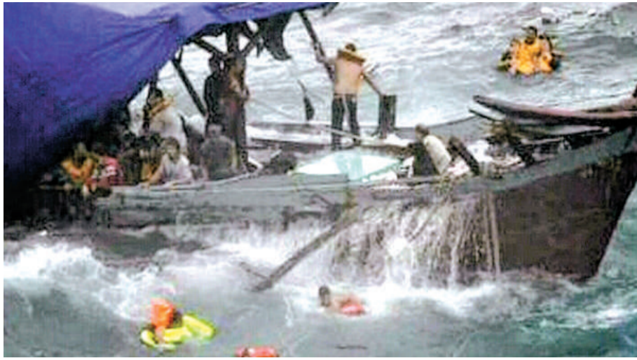
一艘人蛇船在澳洲聖誕島附近遇上滔天巨浪，撞擊岩石後沉沒

【本報訊】據法新社、《泰晤士報》十五日報道，一艘載有多達 80 名尋求庇護者的船，星期三早晨在澳洲外海撞船並解體，目前已知 27 人死亡，42 人獲救。