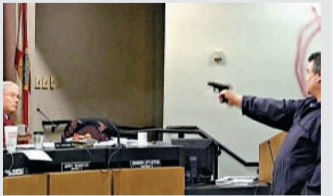
▲杜克（右）舉槍對準一名校董

杜克什麼都聽不入耳，慢慢舉起手上的槍，瞄準胡斯菲特。胡斯菲特懇求：「請別這樣！請別這樣！」杜克開了一槍，但沒打中任何人。一名警衛伺機衝入會場內，與杜克交火，將他擊傷。最後，杜克向自己開槍，中彈斃命。