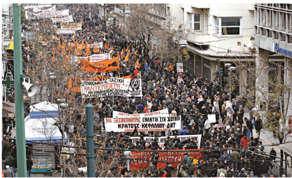
▲大批希臘示威者 15 日走上雅典街頭抗議政府削減公務員工資

【本報訊】據法新社雅典十五日消息：希臘總工會 15 日開始新一輪大罷工，抗議政府執行的削減財政開支計劃與勞動、退休等制度改革。