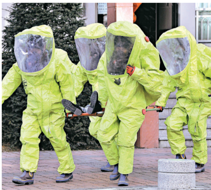
▲韓國 15 日舉行大規模全民民防演習，圖為救援人員在演習期間救出一名「受傷」民眾

日美澳韓曾於 10 月在釜山海外針對防止大量破壞武器的構想實施海上封鎖演習。報道引述日本政府有關人士的看法指出，希望經由 4 國對話的定期化，使中國和朝鮮約束各自的挑釁行為。