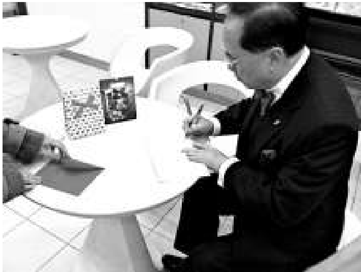
▲特首昨日下午探望汪氏姊弟，並給兩姊弟寫聖誕卡送上節日祝福

而外交部發言人姜瑜十四日表示，菲律賓旅遊部長將就馬尼拉人質事件的調查報告訪問香港，但不會到訪北京。姜瑜說，中央政府一直非常關切人質事件的善後處理，並與特區政府及菲律賓政府保持溝通，希望及相信菲律賓政府可以繼續採取有效措施，妥善處理人質事件的善後工作。