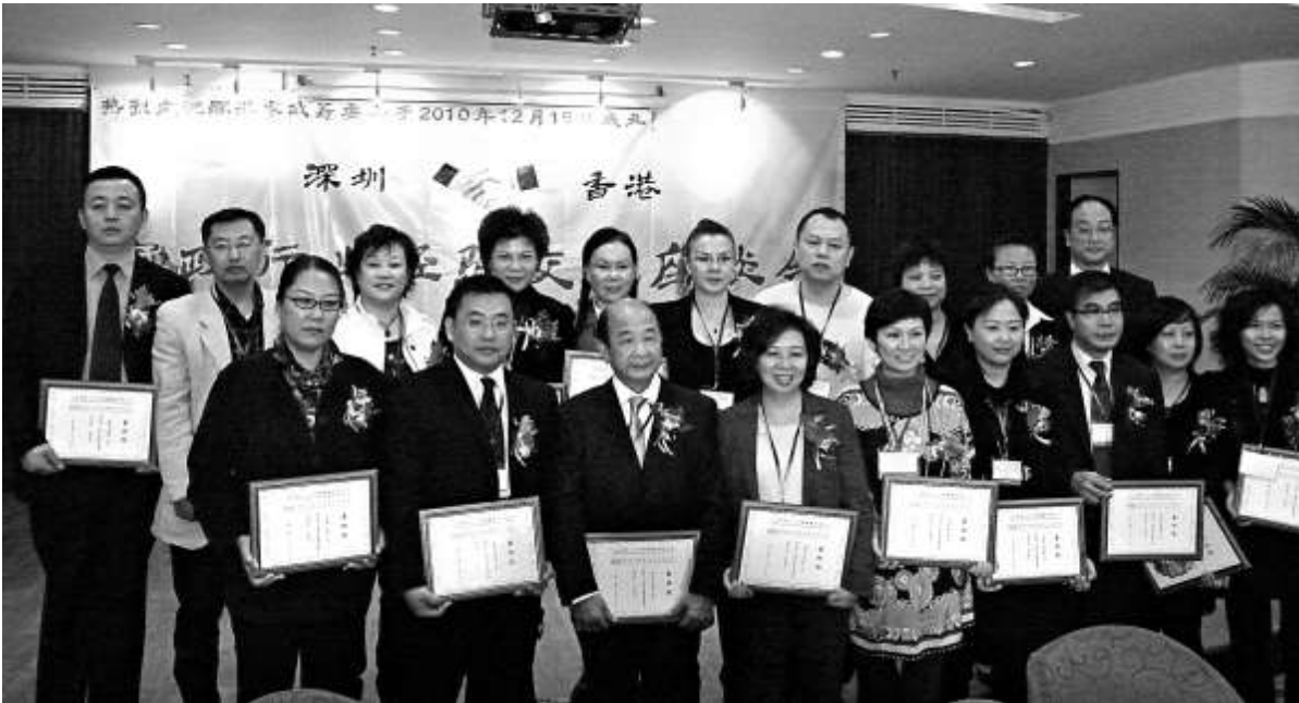
▲深港家政籌委會成立大會昨日在深圳舉行，當日同時舉行了深港家政行業經驗交流座談會

據香港人力代理總會介紹，至今年十月，在港外傭有近二十八點五萬人，其中印傭多達十四萬，菲傭佔十三點六萬，其餘七千多人為泰國、斯里蘭卡或厄尼泊爾籍。按照香港政府規定的薪酬標準三千五百八十元港幣／