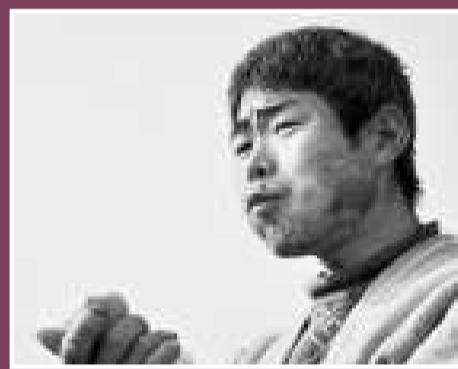
▲這位民工的午餐十分簡單