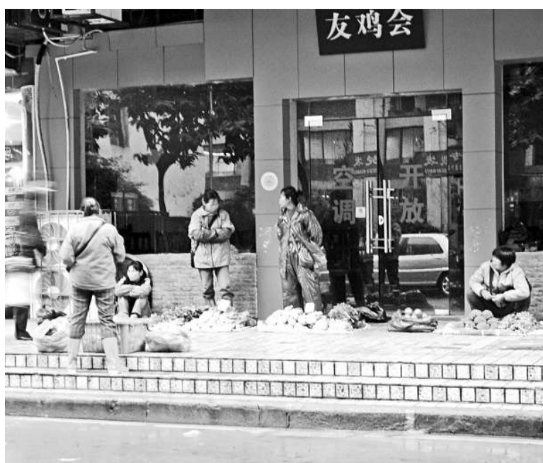
▲物價漲了，廣州「走鬼檔」的身影再度出現