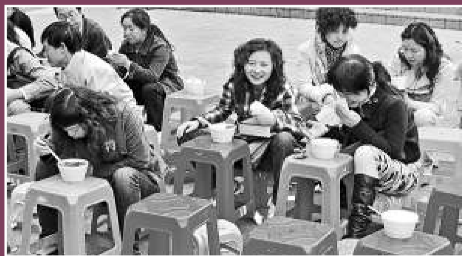
▲農民工的午餐是「好又一餐，不好又一餐」，難怪網上流傳的南京機關食堂的「每周菜譜」讓人羨慕。圖為深圳一班打工仔正在忙碌地吃着午餐

不過，李文波也承認，食堂的價格比外面確實便宜一些，但也僅僅是「不盈利」而已。而對於網友質疑的「是不是享受伙食補貼」一說，李文波說「絕對沒有」。