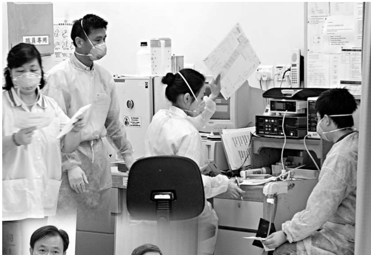
▲為應付公立醫院醫生人手不足的問題，醫院管理局打算引入兼職醫生制 資料圖片

另外，醫管局大會亦討論藥物供應管理，建議向藥物供應商實施記分制，若供應商於提供的藥物質素或送貨時間出現問題，便會被記分。而記分多寡與事故的風險水平掛鉤，將會定出高、中、低三種風險，如藥物受霉菌污染會記一百分；貼錯劑量標籤將記三十分，沒有貼上毒藥標籤記二十分。若供應商於一年內記滿六十分，便要接受初檢委員會審核表現，而記滿一百分就會被終止合約直至情況有改善。有關計劃將於明年初實行，