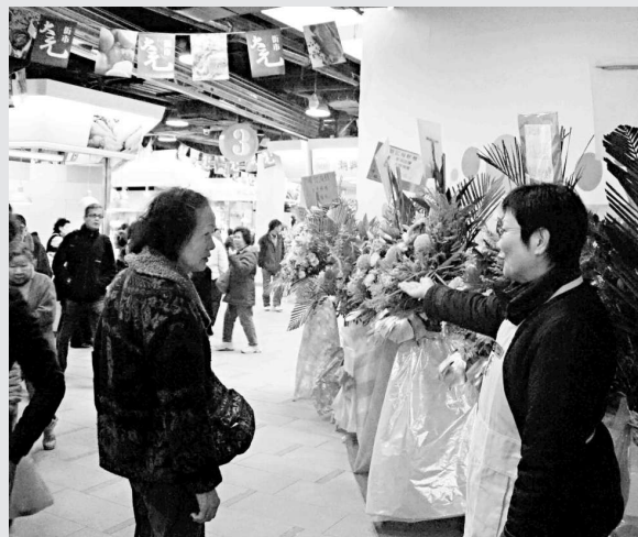
▲大元街市試業人流攞動