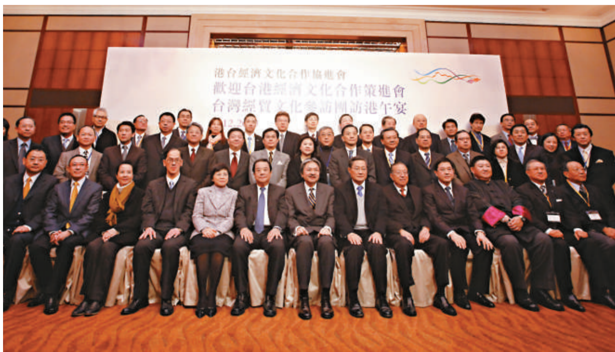
▲林振國（右六）昨日率領四十人的大型交流團首度訪問香港，獲曾俊華（右七）設宴款待

台灣策進會赴港訪問團成員包括文化、經濟兩個委員會的召集人徐利玲、陳武雄與相關委員，以及台灣金融、科技、旅遊等產業界負責人，共約四十人。訪問團將在港進行一系列經貿、文化參訪活動，明日結束訪港行程。