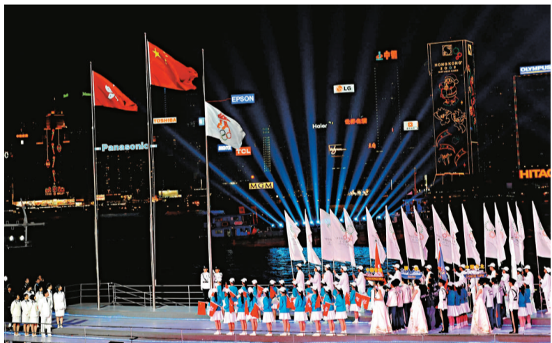
▲去年東亞運在港圓滿舉行，令人對香港能舉辦類似的大型盛事增添了信心 資料圖片

另外，行政長官曾蔭權將於本月二十至二十三日到北京述職。在北京期間，曾蔭權將向國家領導人匯報香港經濟、社會和政治發展的過去一年情況。他亦會與港澳辦、發改委、商務部、外交部、人民銀行、銀行業監督管理委員會和證券監督管理委員會等中央部委官員會面。